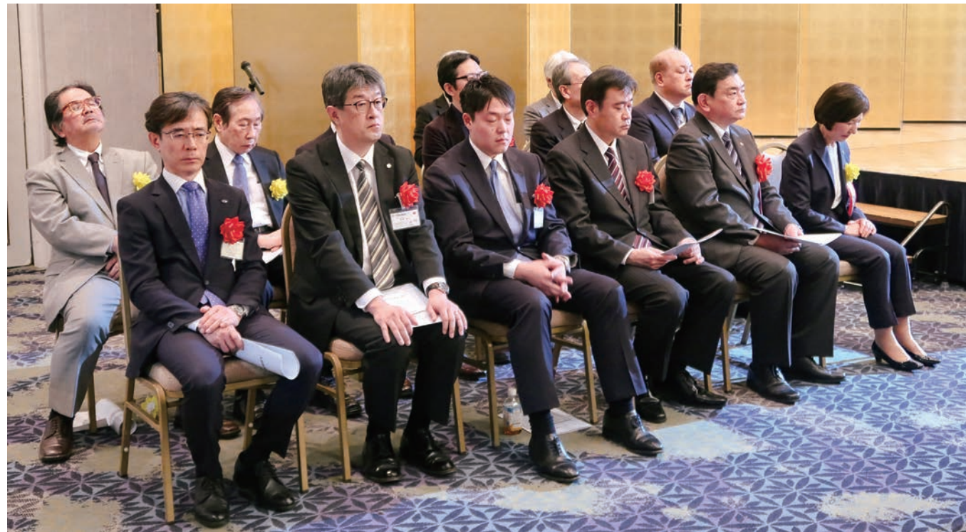
▲実行委員の方々と本社関係者