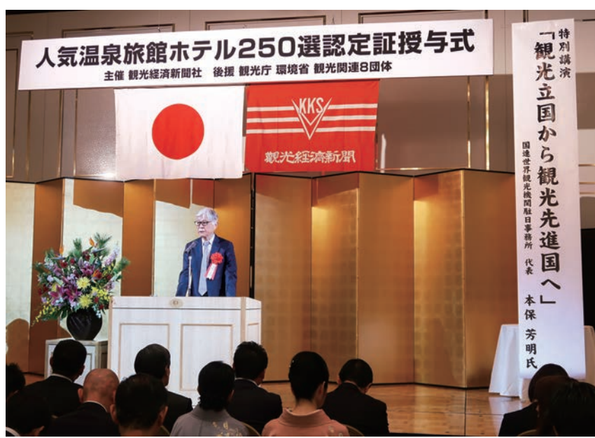
▲「観光立国から観光先進国へ」をテーマに講演するUNWTO駐日事務所代表の本保芳明氏