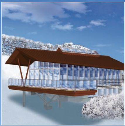
今シーズンOPEN! 展望レストラン CRYSTAL 天 [てん]