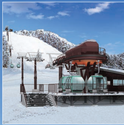
今シーズンOPEN! PULSE GONDOLA TENGU