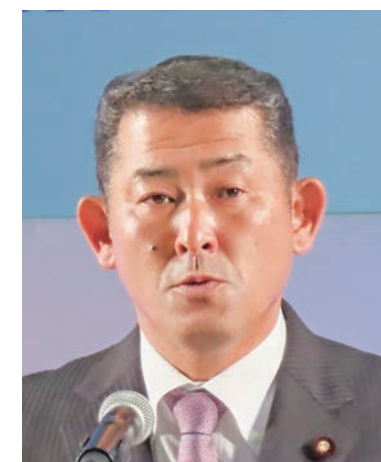
石井浩郎国土交通副大臣がいさつ