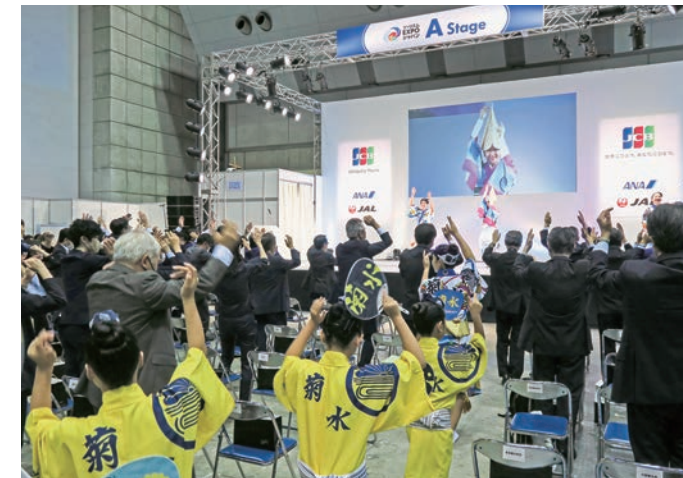
観光関係者が参加して踊った「阿波踊り」