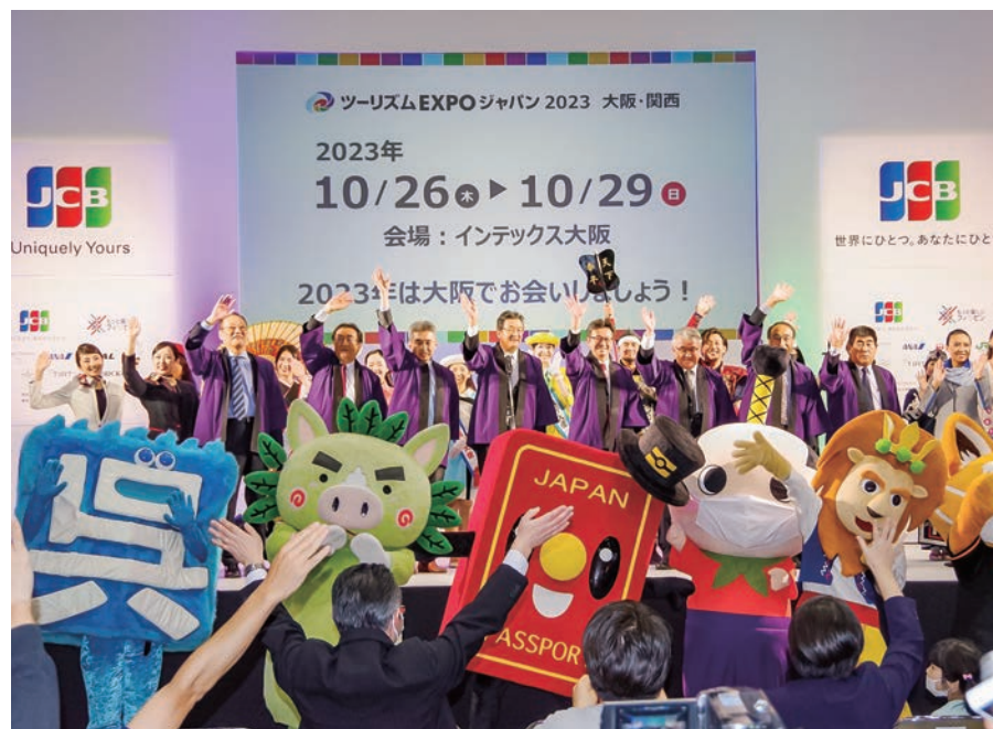
観光需要の回復を誓ったグランドフィナーレ

9月22〜25日、ツーリズムEXPOジャパン2022が東京都江東区の東京ビッグサイトで開かれた。世界78の国と地域、1018の企業・団体が出展。会期中の来場者数は12万2千人を記録した。観光回復を期待し、にぎわう会場の様子を写真で紹介する。