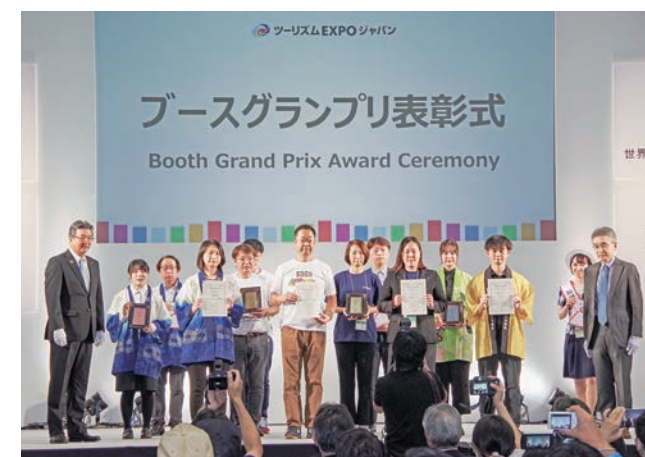
優れたブースを選ぶブースグランプリ