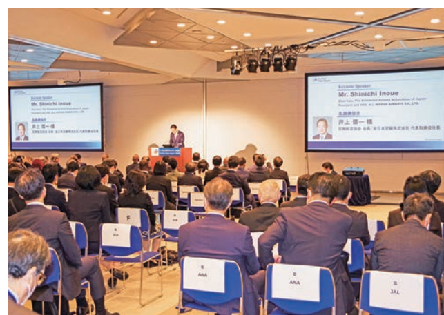
シンポジウムや特色ある多種多様なセミナーが開催