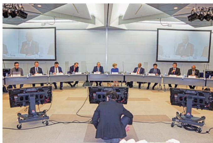
世界7カ国が集った観光大臣会合