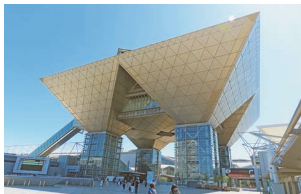
4年ぶりに東京(東京ビッグサイト)で開催

9月22〜25日、ツーリズムEXPOジャパン2022が東京都江東区の東京ビッグサイトで開かれた。世界78の国と地域、1018の企業・団体が出展。会期中の来場者数は12万2千人を記録した。観光回復を期待し、にぎわう会場の様子を写真で紹介する。