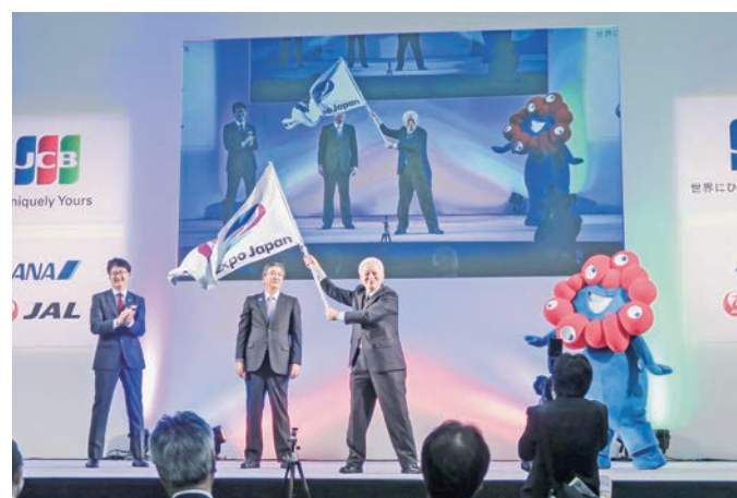
23年の会場となる大阪に開催旗を引き継いだ