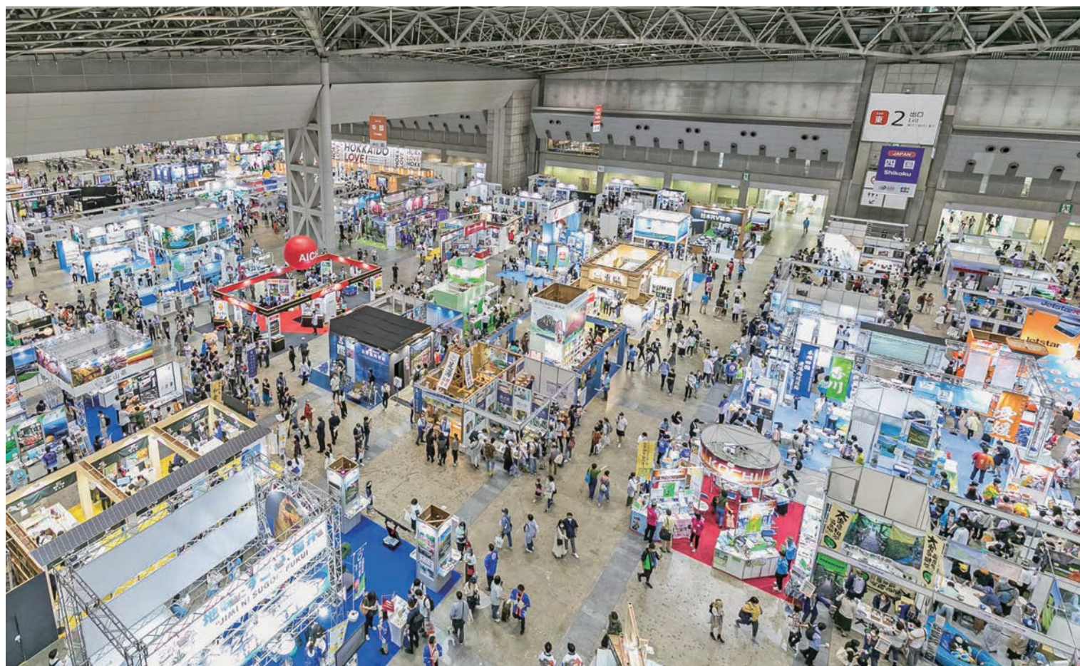
業界日、一般日の計4日間の会期中に12万2000人が来場