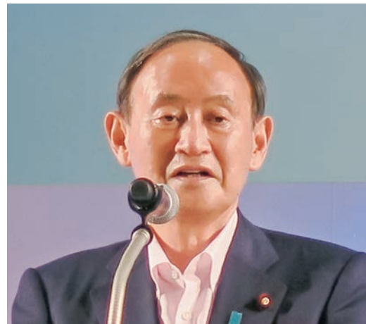
オープングレセプションで祝辞を述べる菅義偉前首相