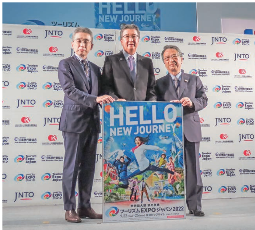
主催3団体が一体となり会場を運営