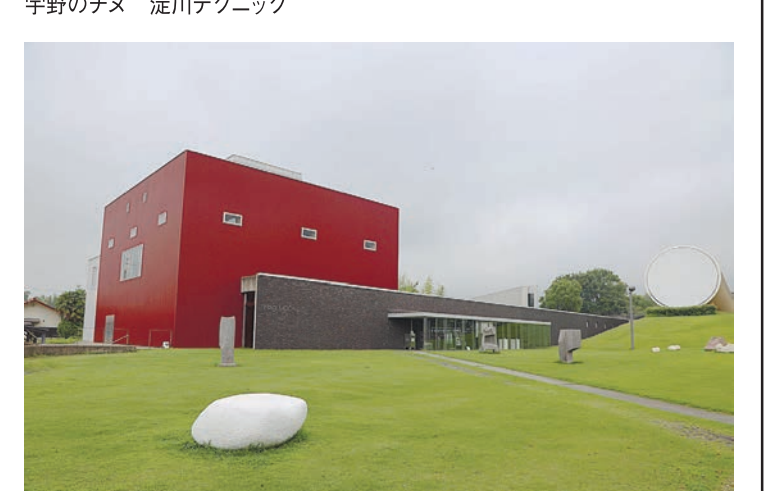
奈義町現代美術館