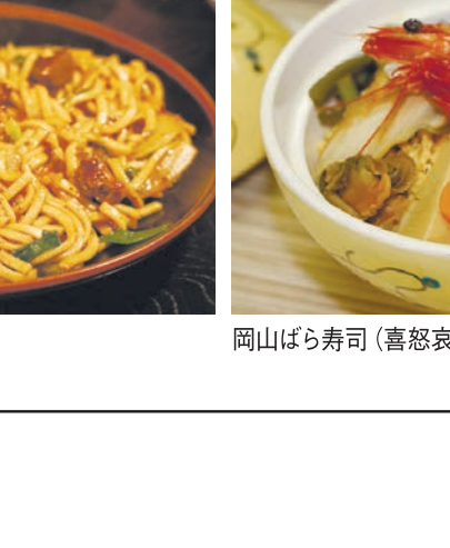
ホルモンうどん(上屋)