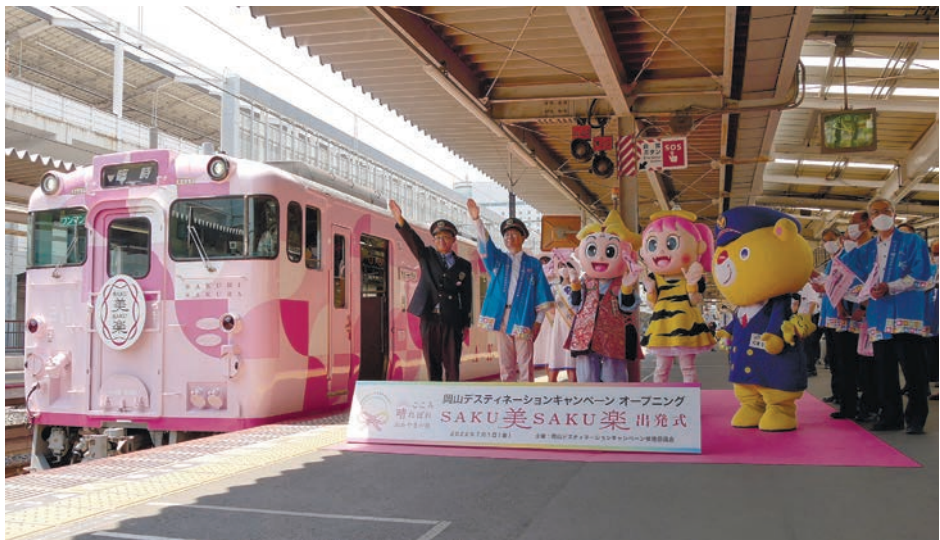
オープニングセレモニー「SAKU美SAKU楽」の出発式

岡山デスティネーションキャンペーン(以下、岡山DC)が7月1日から9月30日まで開催。展開エリアは岡山県全域と広島県福山市及び尾道市。キャッチフレーズは「こころ晴ればれ おかやまの旅」。5つのテーマ「アート・ビュー・テイスト・ヒストリー・リラククス」にあわせた多彩な観光素材を用意。豊かな自然や朝と夜の楽しみ方、フルーツをテーマにした企画などが楽しめる。岡山DCに合わせて観光列車「SAKU美SAKU楽」の運行もスタート。岡山県で夏に初めて、夏が旬のフルーツを味わえたり、夏のアクティビティを満喫できる。