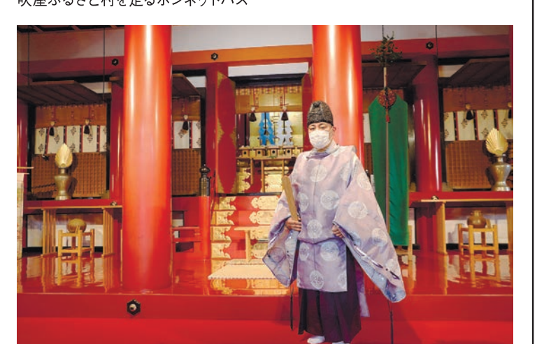
正式参拝と境内案内・鳴釜神社(吉備津神社)