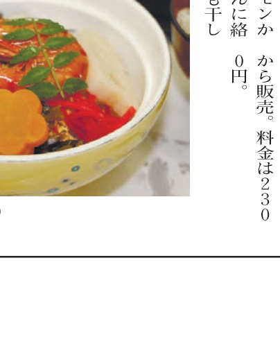
岡山ばら寿司(喜徳斎菜)

「ラ・マル ことひら」は、岡山県で夏に初めて、夏が旬のフルーツを味わえたり、夏のアクティビティを満喫できる。