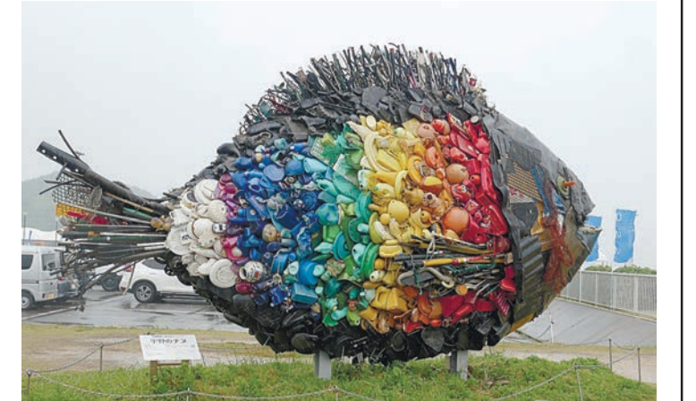
宇野のチヌ 淀川テック

岡山県で夏に初めて、夏が旬のフルーツを味わえたり、夏のアクティビティを満喫できる。