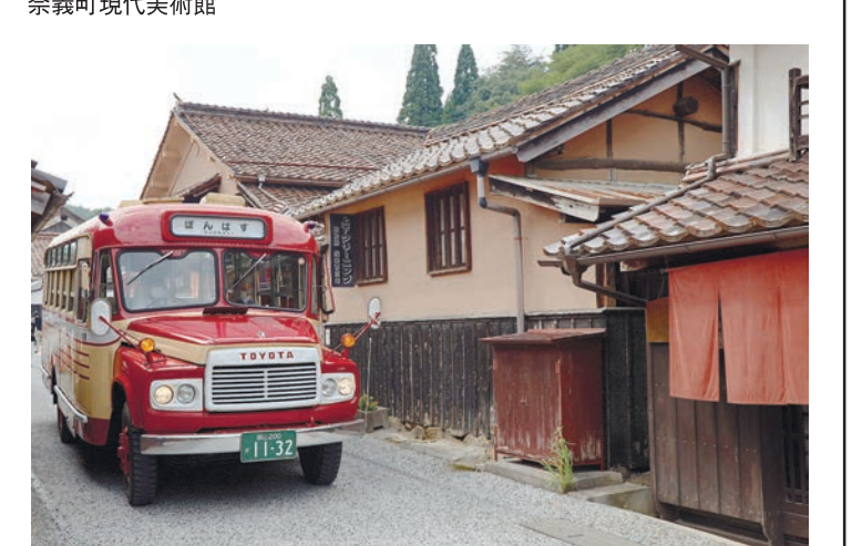
吹屋ふるさと村を走るボンネットバス