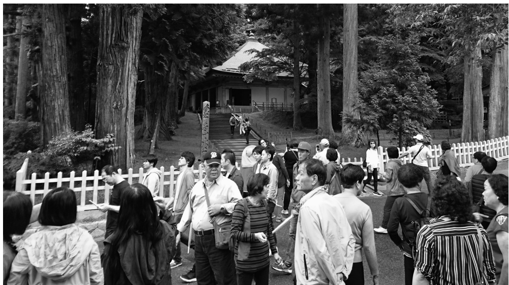
外国人観光客でにぎわう平泉中尊寺金色堂