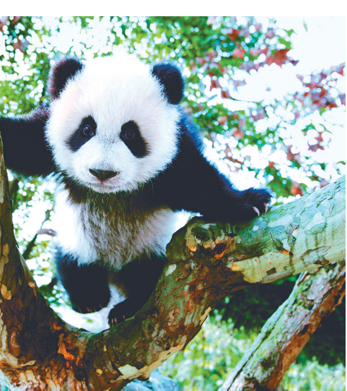
ジャイアントパンダ

都江堰 都江堰は、2000年前に築かれた分水堰。岷江の水を成都平野に供給するために築かれた。世界遺産に登録されている。 ●都江堰 都江堰は、2000年前に築かれた分水堰。岷江の水を成都平野に供給するために築かれた。世界遺産に登録されている。