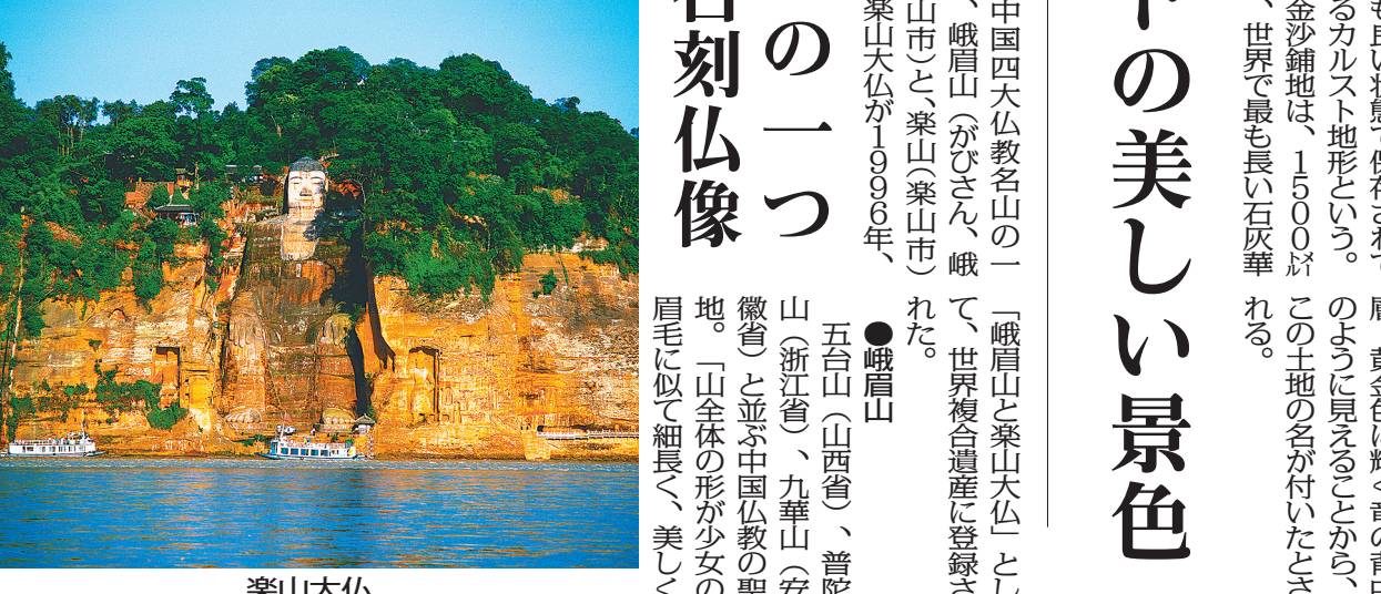
峨眉山(金頂) 樂山大仏

中国四大佛教名山の一つ、峨眉山(がひさん)峨、世界複合遺産に登録された。世界で最も大きな石刻仏像、樂山大仏(がくおん)が、900年前に完成した。 ●樂山大仏 樂山大仏は、900年前に完成した。世界で最も大きな石刻仏像。長さは71メートル、高さ71メートル、重さ約100,000トン。