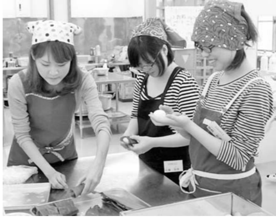
ホームステイ先でのだんご作り