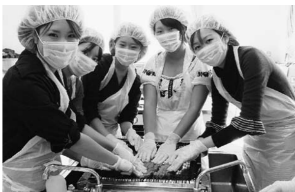
水産加工体験の1つイクラづくり