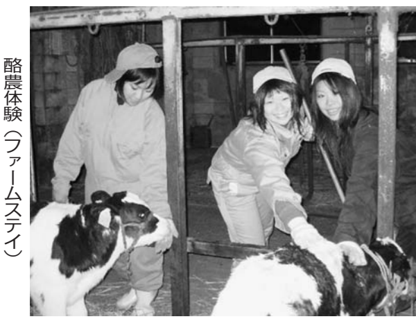
酪農体験(ファームステイ)

北海道の最東端で根室海峡沿岸の中央部に位置する標津町(しべつ)は、人口約5800人、目の前24の根室海峡が浮かび、左には世界自然遺産の秘境知床半島が一望でき、その山並みは半島基部を形成する当町、右にラムサール条約登録地として指定され、丹頂鶴、オオワシなど野鳥の宝庫として名高い野付半島、背後にはミクらの里の雄大な牧草地帯が広がる大酪農地帯が広がるなど、風光明媚な地です。当町は、北海道らしい