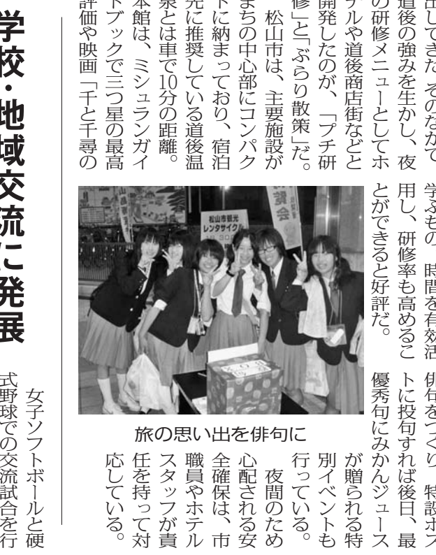
旅の思い出を俳句に... 夜の間に、夜間のため心配される安全確保は、市職員やホテルスタッフが責任を持って対応している。