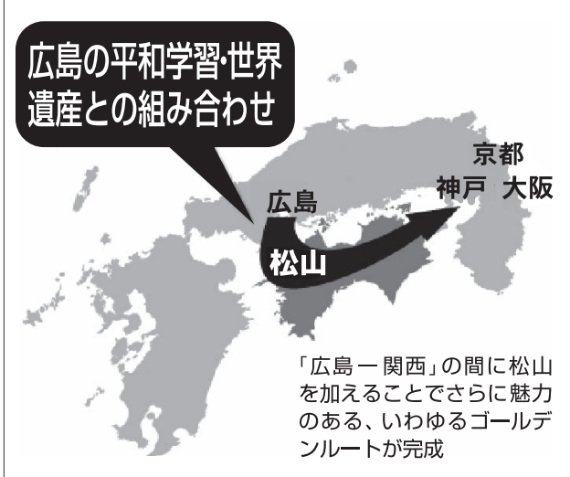
「広島一関西」の間に松山を加えることでさらに魅力のある、いわゆるゴールデンルートが完成