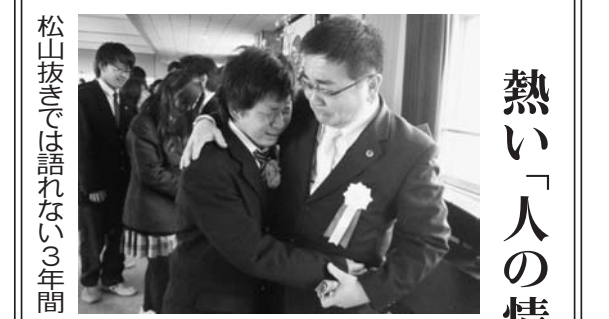
立花高等学校 熱い「人の情」を強く体験