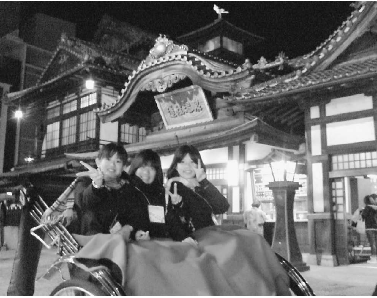
夜の研修メニューに歓声。人力車、道後温泉本館前での記念写真、そして本館前から広がる商店街は夜の散策体験に最適