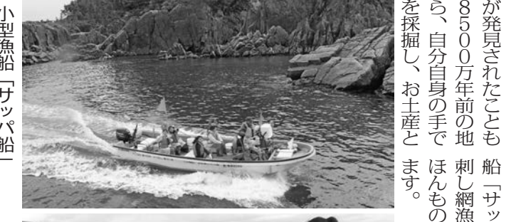
小型漁船「サッパ船」