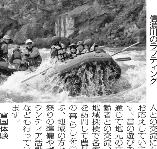
信濃川のラフティング

越後田舎体験の特徴 ①日本海の長い海岸線と、米どころ新潟の広い平野、そして棚田やブナ林がある日本の原風景が残る中山間部を持つ越後田舎体験エリアは、自然・環境・歴史民俗学習の適地です。