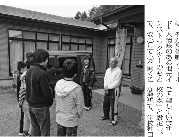
心の通う民泊で地元の人々と触れ合う