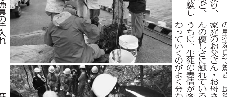
漁港で漁具の手入れ