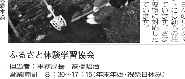
森から学ぶ林業体験