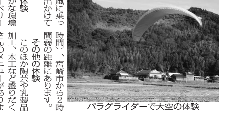
パラグライダーで天空の体験

霧島山トレッキング 霧島山トレッキング 霧島山トレッキング 霧島山トレッキング 霧島山トレッキング 霧島山トレッキング 霧島山トレッキング 霧島山トレッキング 霧島山トレッキング 霧島山トレッキング