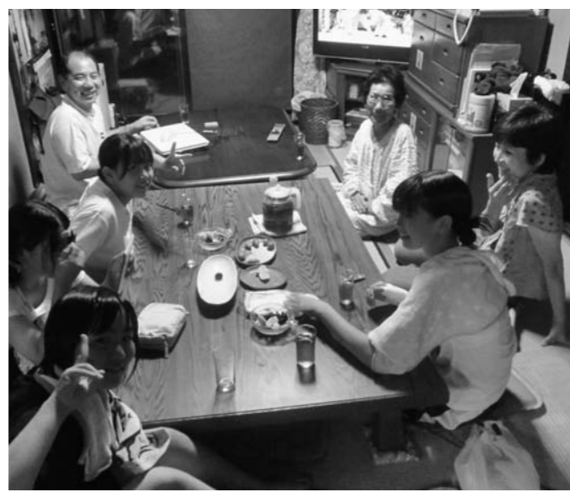
互いの思いやりの大切さが体感できる民泊

安芸太田町は、「西中 民宅へ民泊することで、 団結力」互いを思いや り、交流・元気まち」が スローガン。元気のまち」を 思いやり、先祖を敬い、命 の大切さを子供たちに伝 えるのが、この町の目標 だ。広島県内最少人口(7 400人)弱でありなが ら、神楽団は17団体存在 する地域と人々のつなが りが極めて強い町です。 そんな人情あふれる町