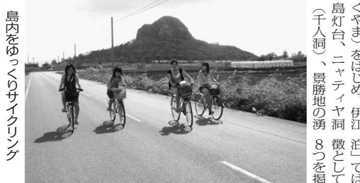
島内をめぐってサイクリング

大戦後、焼け野原にな 出(わ)じ(は)か島内を、 り草木ひとつない島を、 ゆくりと時間をかけて ここまで復興させた伊江 島。沖縄でトップクラス の第一産業の島で、ド の体験メニューを用意し ています。美(ちゅ)ら ムリンズスポーツは当然 すが、ます島そのものを ニュを紹介します。 体感するに、レンタカ イクルが最適です。島内 の見所である城山(ぐす) 「島体感宿 ぐすま)をはじめ、伊江 島灯台、ニヤティヤ洞 微として次の (千人洞)、景勝地の湧 8つを掲げて