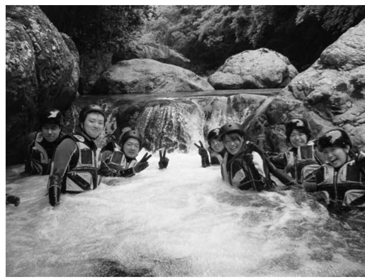
身体ひとつで沢を滑降するキャニオニング

2005年に八代地域 の1市2町3村が合併 し、新しい八代市が誕生 しました。八代市は、熊 本県のほぼ中央部に位置 し、東は九州山地の脊梁 地帯で宮崎県と接し、西 は不知火の海、八代海ま での市域を有し、豊かで多 様な自然に恵まれた人口 約14万人、総面積680 平方キロメートル。その 地理的条件を活かした豊 かな農林水産業と活気に 満ちた工業を併せ持つ、 歴史と伝統文化が息づ いています。