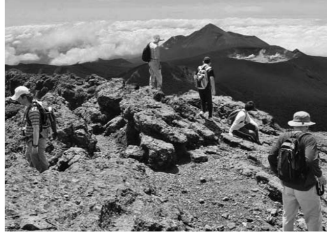
大地の鼓動を肌で感じる霧島山トレッキング (右上のくぼんだ山頂が新燃岳)