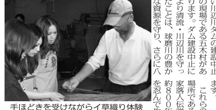
手ほどきを受けながら草織り体験

古くから政治・経済、と水俣病につ いて学ぶこと 市、八代平野 の前に広がる 八代海では海 の環境につい て、学べ、豊か な漁場がある 八代海に流れ 込む球磨川の 八代市内から南下する を迎える全国に例を見な 守ることに繋がっている の生活が残っているの ます。