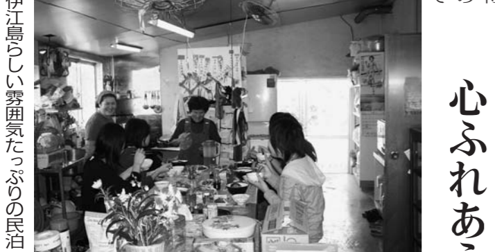
伊江島らしい雰囲気たっぷりの民泊

やさしい島のひととき 心ふれあうひととき 心ふれあうひととき 心ふれあうひととき 心ふれあうひととき 心ふれあうひととき 心ふれあうひととき 心ふれあうひととき 心ふれあうひととき 心ふれあうひととき