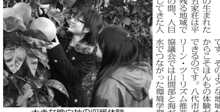
大きな晩白柚の収穫体験

大きな晩白柚の収穫体験 大きな晩白柚の収穫体験 大きな晩白柚の収穫体験 大きな晩白柚の収穫体験