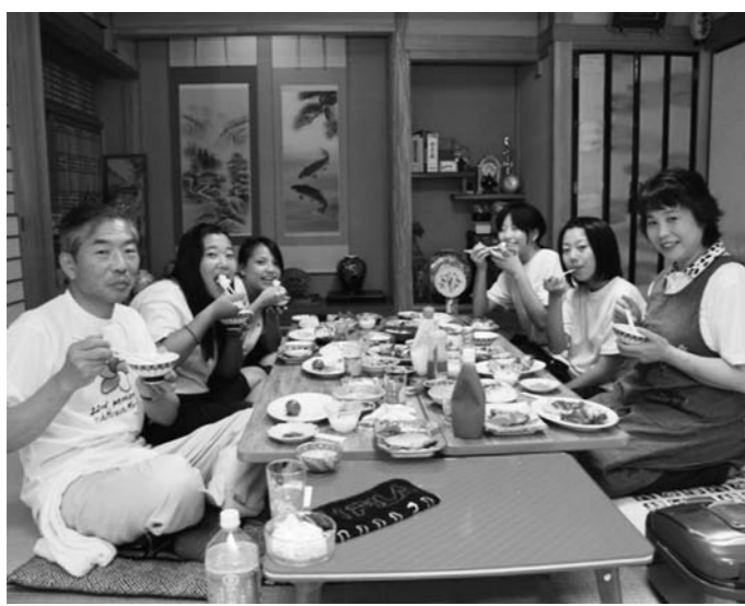
田舎の温かさや人と人とのつながりの大切さを知る民泊