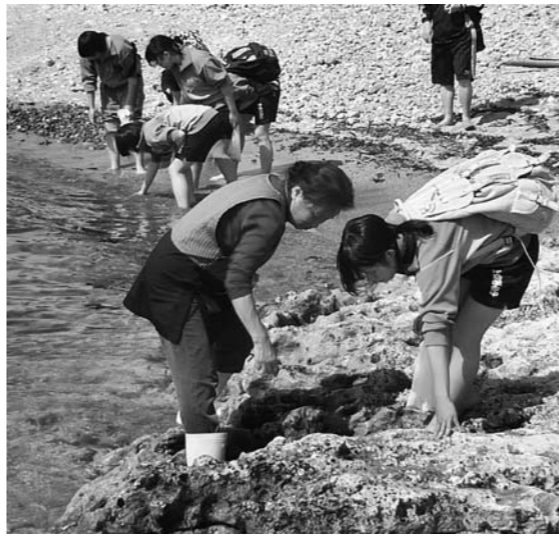
農家漁家の民泊で人と海へ