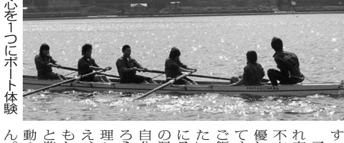
心を一つにボート体験