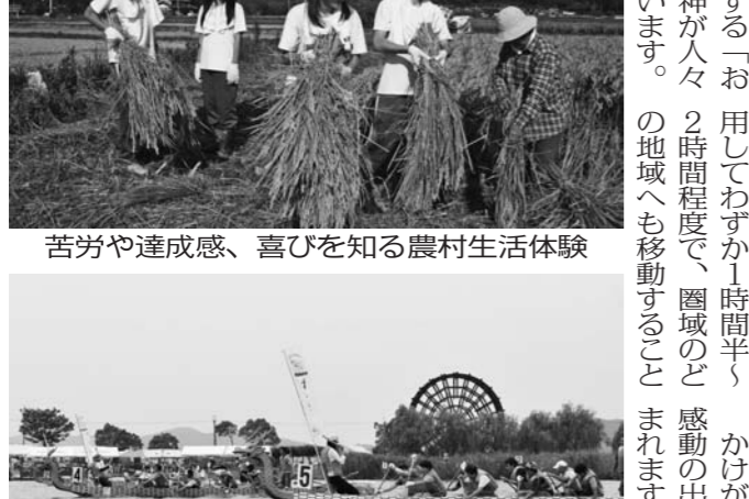
苦労や達成感、喜びを知る農村生活体験