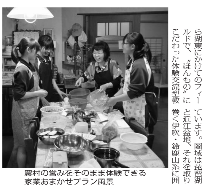
農村の営みをそのまま体験できる家業おまかせプラン風景

〒522-0071 滋賀県彦根市元町4-1 滋賀県湖東合同庁舎1階 TEL 0749-23-0038 FAX 0749-23-4038 E-mail: info@ohmiji.jp