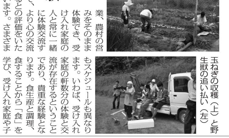
玉ねぎの収穫(上)と野生獣の追い払い(左)

〒529-1698 滋賀県蒲生郡日野町河原1-1 日野町商工観光課内 TEL 0748-52-6562 FAX 0748-52-2043 E-mail: kankou@town.shiga-hino.lg.jp URL http://www.omo-hino.jp/