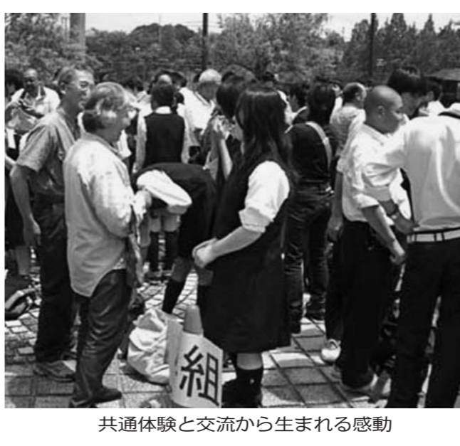
共通体験と交流から生まれる感動