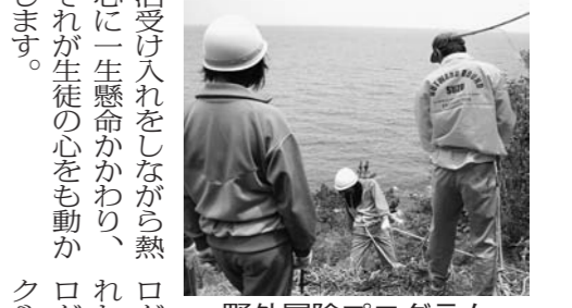
野外冒険プログラム