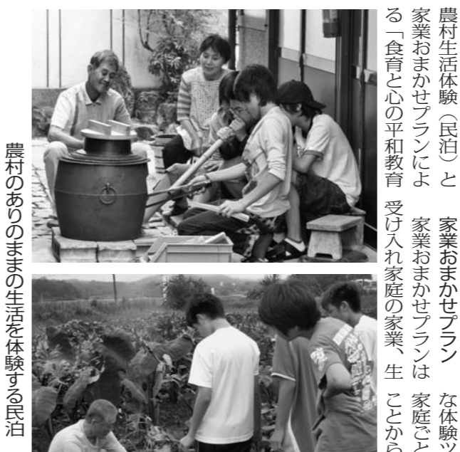
農村のあじの暮らしを体験する民泊