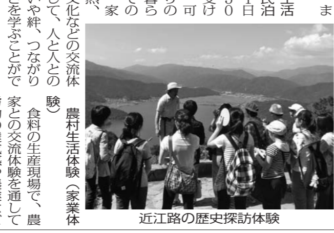
近江路の歴史探訪体験