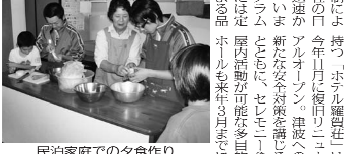
民泊家庭での夕食作り