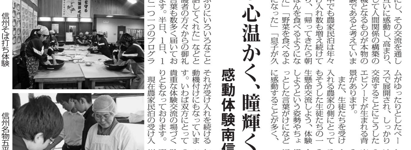
家族の一員になる民泊