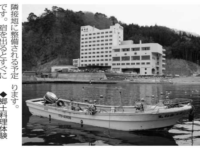
ホテルの目の前がそのまま体験ロケーション