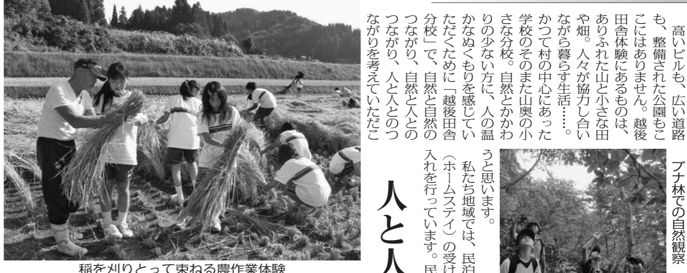
稲を刈りとりて束ねる農作業体験