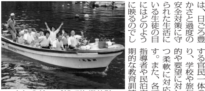
人気のサップ船で漁業体験