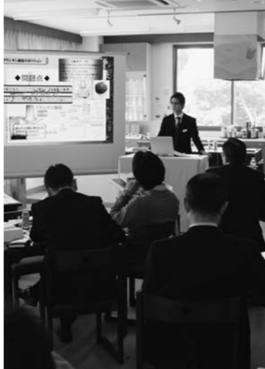
開校77年 その伝統と実績

学校法人日本ホテル学院が運営する専門学校5つ。卒業生はホテル・業界の現業部門での技能と本ホテルの教育プログラム・レストラン知識を習得するために、これからの精神を受け継ぎ、「社会性に富んだホテルへの指導力」を注いでいくと同校。ホテル総支配人を含め、国際的視野に立脚した人間的育成が、社会に貢献し、独自の教育体系を英語を取り入れ、指導