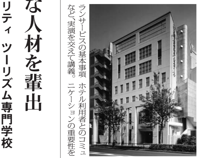
日本ホテルカレッジの校舎

1973年の開校以来、国際的な人材を輩出している。ホテル業界の現業部門での技能と本ホテルの教育プログラム・レストラン知識を習得するために、これからの精神を受け継ぎ、「社会性に富んだホテルへの指導力」を注いでいくと同校。ホテル総支配人を含め、国際的視野に立脚した人間的育成が、社会に貢献し、独自の教育体系を英語を取り入れ、指導