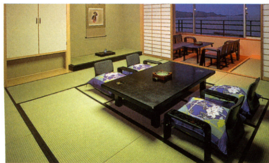
嬉春亭「デラックススイートルーム」