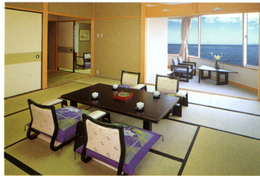
「スーペリアスイートルーム」