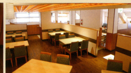
テーブル席スペース