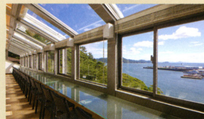
オープンテラス席スペース