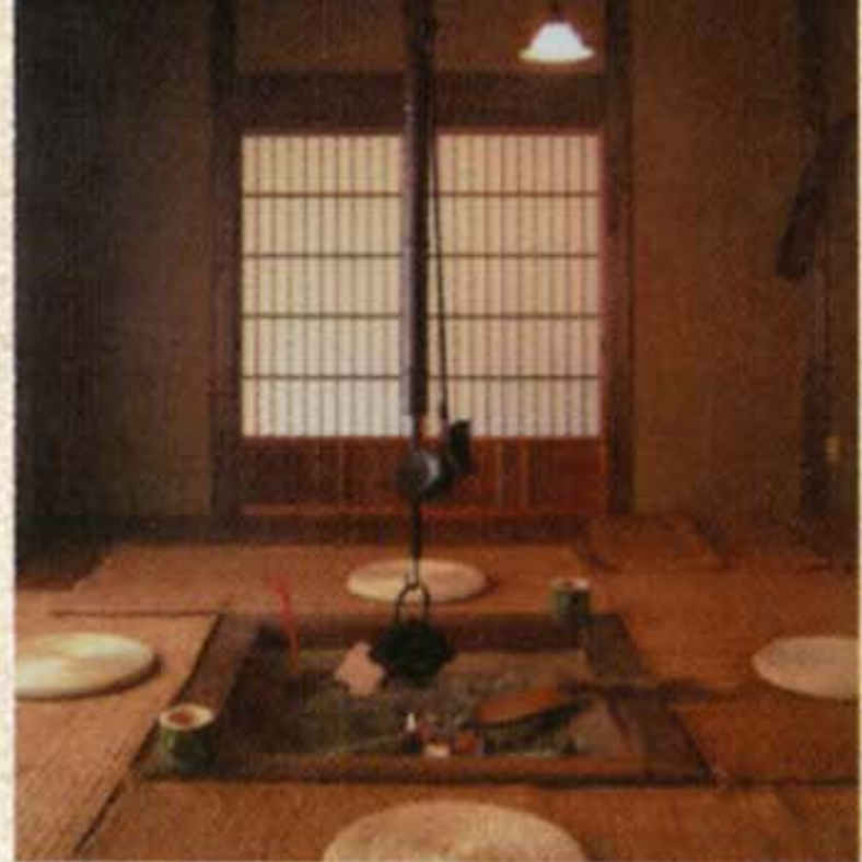
●湯上り処 「半兵衛の家」