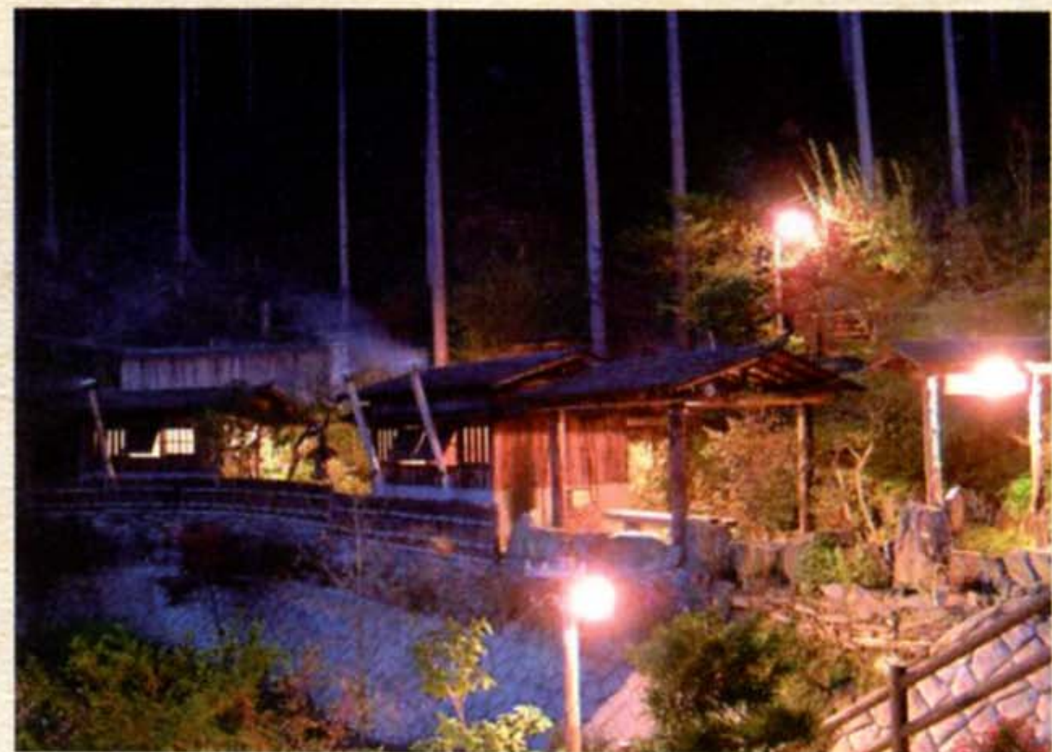
●貸切風呂 「半兵衛の五右衛門風呂」全景