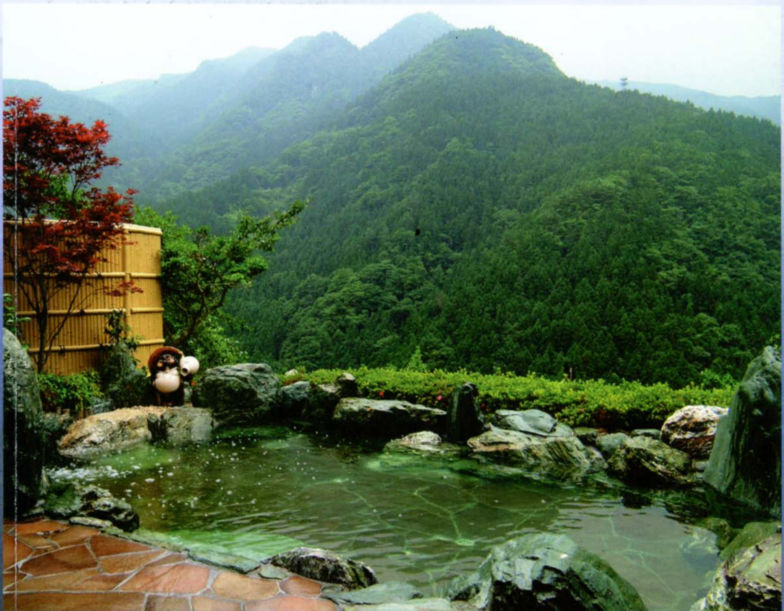
●露天風呂「雲海の湯」