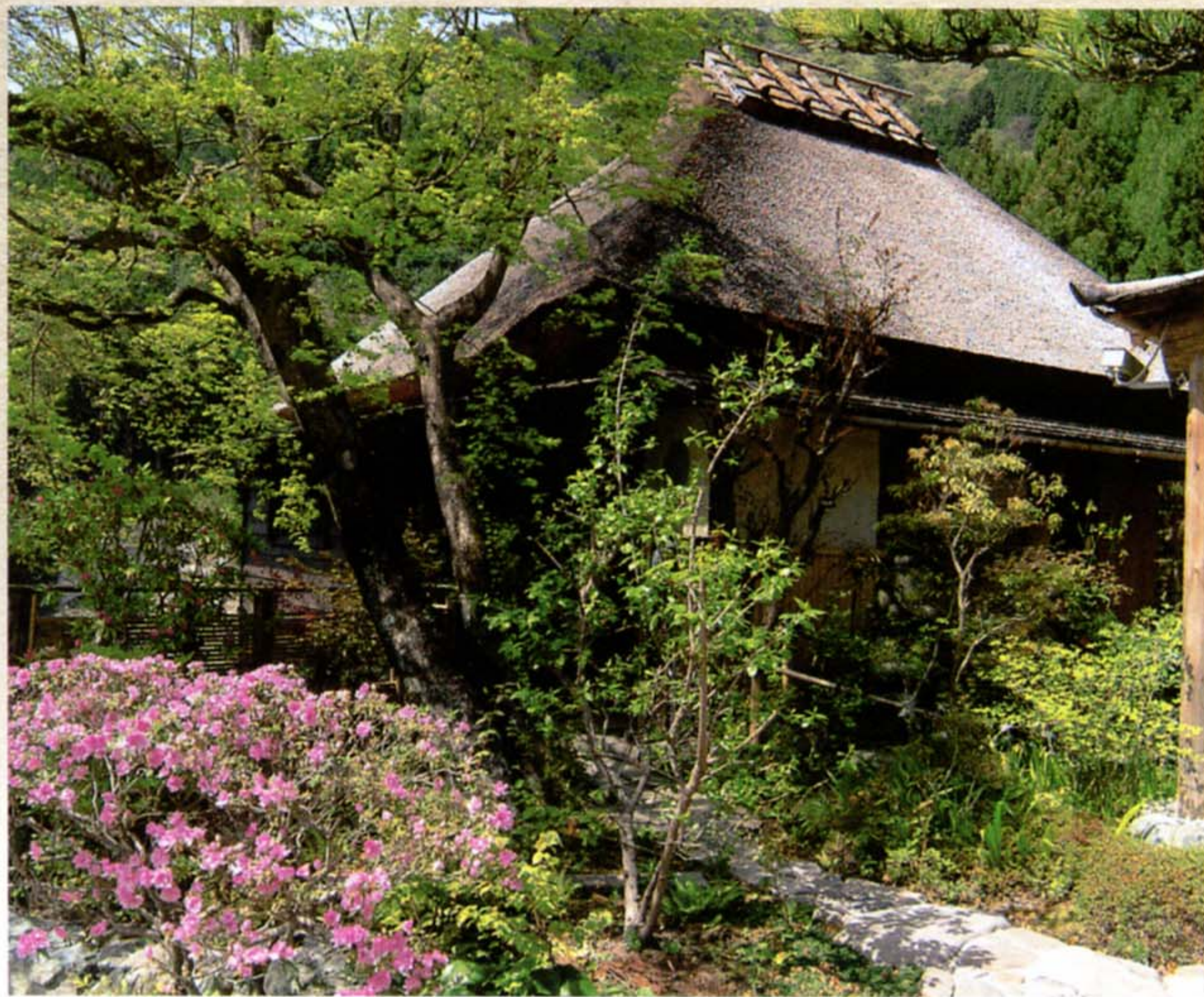
●湯上り処「半兵衛の家」