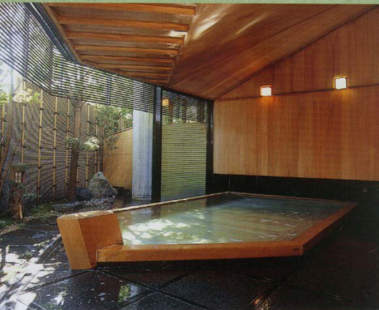
殿方総古代檜風呂

男女それぞれに「総古代檜風呂」・「大理石風呂」・ 「展望露天風呂」を完備しております。