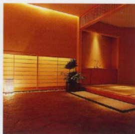
湯処エントランス

総古代檜風呂、展望大理石風呂、展望露天風呂は、金谷ホテル自慢のお風呂として、日本の風情を感じていただける癒しの湯処です。