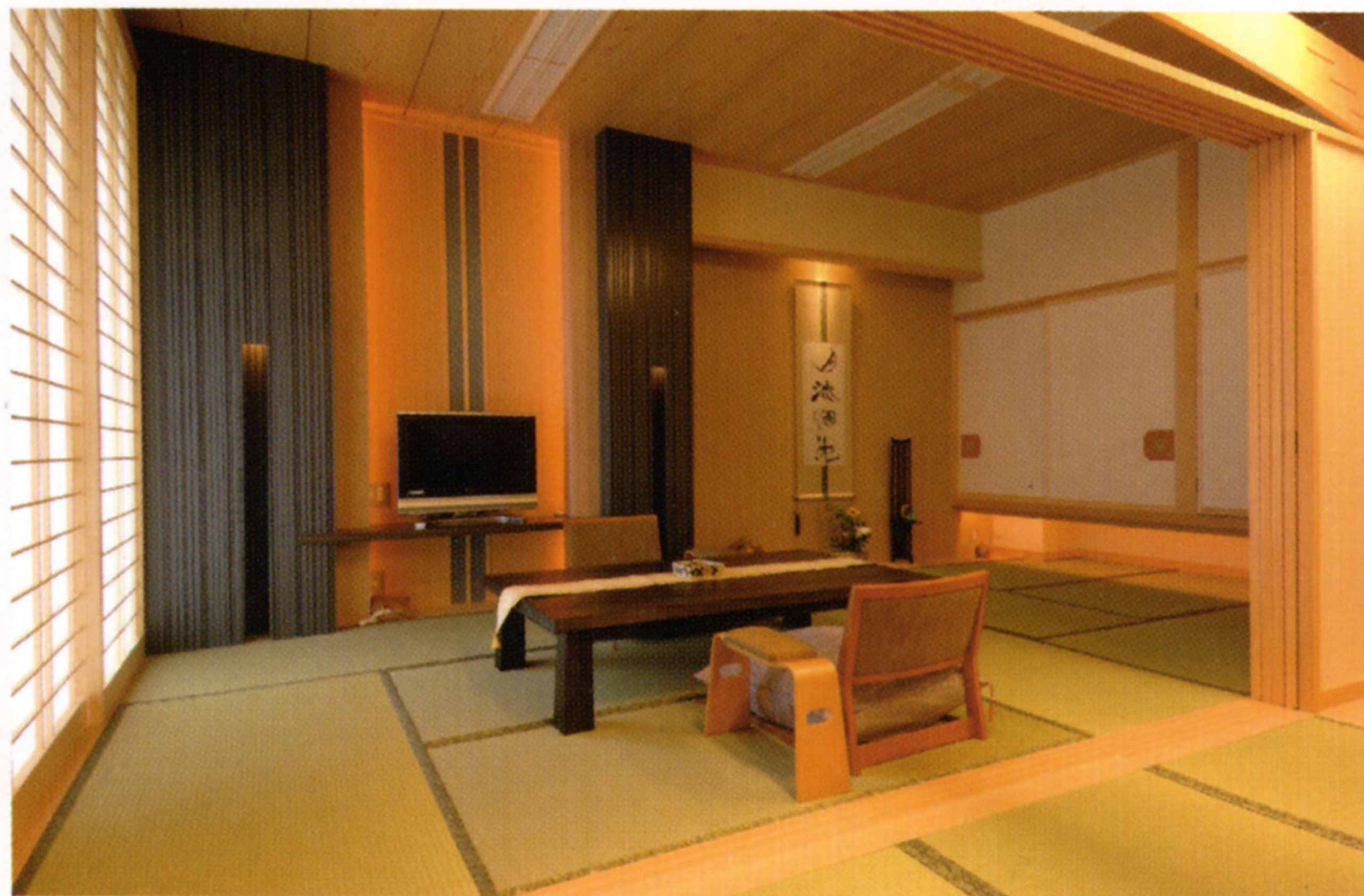
飲泉・自家源泉かけ流し「満天檜風呂」の一般客室（和室タイプ）