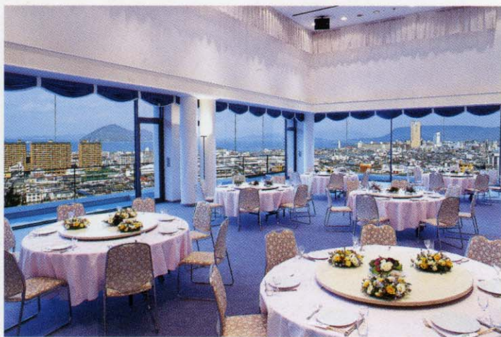
コンベンションホール [海]