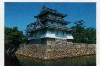
[玉藻城] お車で約5分