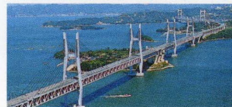
[瀬戸大橋] お車で約40分