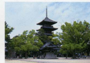
[普通寺] お車で約50分