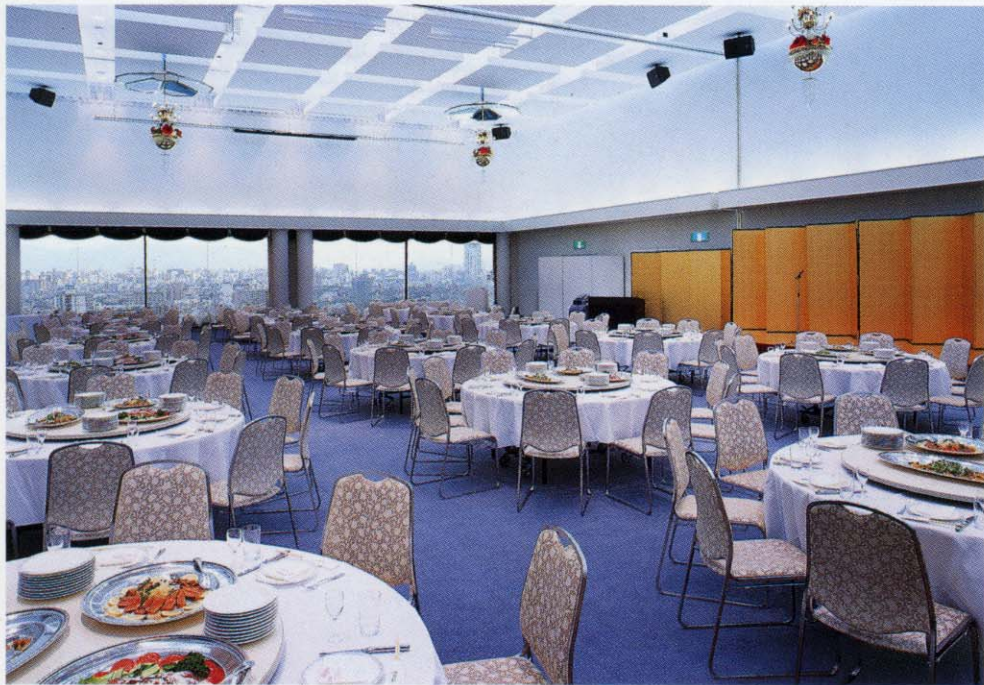
コンベンションホール [花・水]