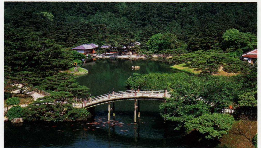
四季折々の風景も美しい名園です [栗林公園] お車で約10分