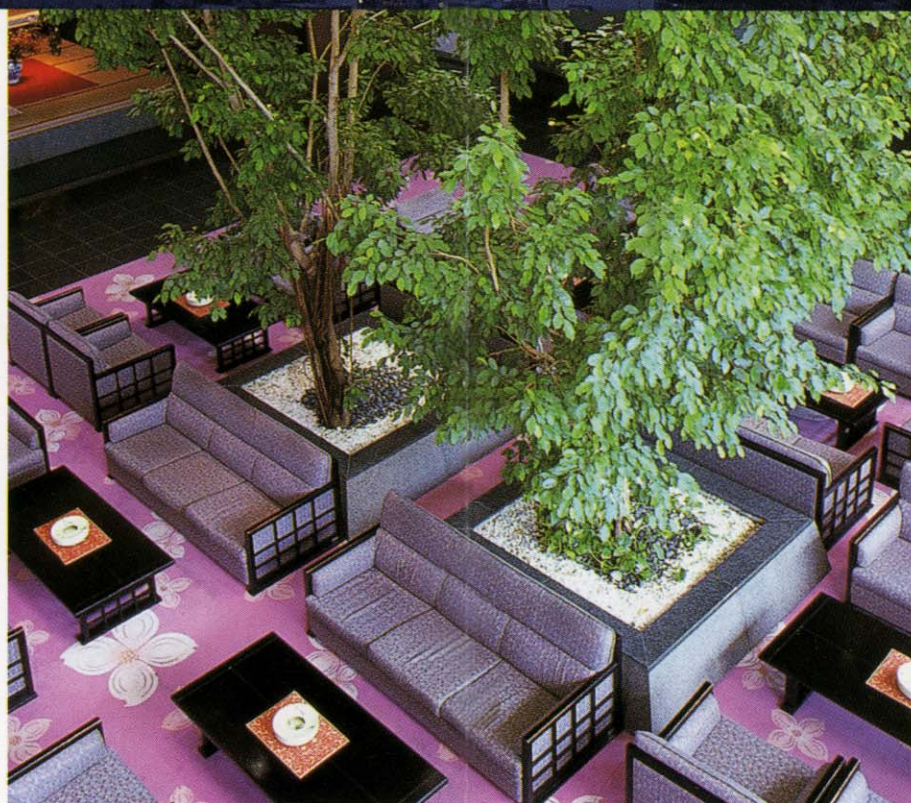
開放的なゆったりとした空間で寛ぎのひとときをお過ごしください。[ロビー]