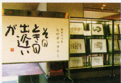
相田みつを心のギャラリー