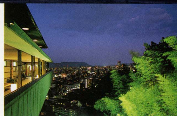
黄昏ゆく街並みの碧の風景も美しい[アプローチ]