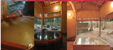
▲3棟の貸切露天風呂