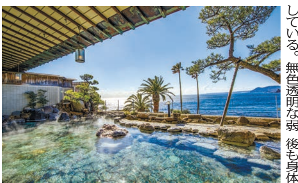
オシヤンビュウの展望露天風呂