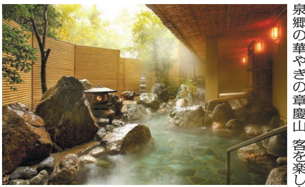
岩大露天風呂 六花仙