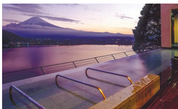
大浴場露天風呂「月」