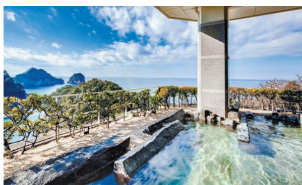
堂ヶ島の絶景を望む露天風呂