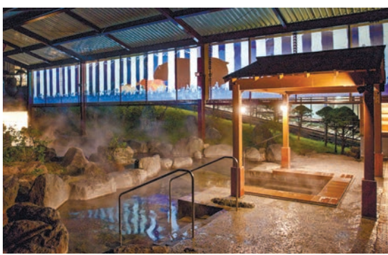
プロジェクションマッピングが好評の大露天風呂ソーン