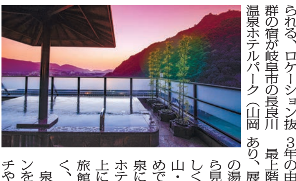
最上階川の湯の露天風呂