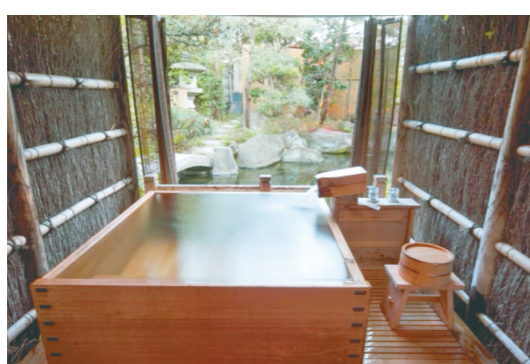
庭園に面した客室露天風呂 (1000円税別)

都心から1時間半という好アクセスながら、「ほろほろ料理」が楽。同館は石和温泉の豊富なしめる宿として知られる。温泉を堪能できる宿として、数ある温泉宿の中でも、根強い人気を誇っている。同館の風呂の売りは「全館かけ流し」。内湯と露天風呂を併設した趣の異なる3つの大浴場、5つの客室露天風呂、山梨の食も堪能できる。天風呂、2つ、八田2886。山梨県笛吹市石和町。電話:055-2622266。http://www.fujino.co.jp/