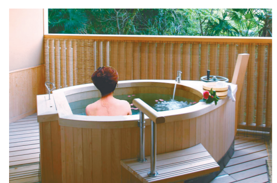
特別室の展望露天風呂

喜代美山荘花樹海(三花に囲まれた「花の宿」)は、矢島洋社長は、峰山緑地公園の東側に位置。大浴場からは、瀬戸内海を一望できる。夜景を楽しむことができる。花樹海温泉の展望露天風呂が付いている。デザインスリムな浴槽があり、すべての部屋に露天ジャグジーが付いている。すべての客室から、瀬戸内海の景色を堪能できる。電話:087-35510。http://www.hanajukai.jp/