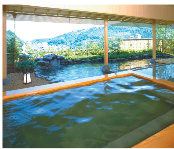
展望露天風呂「天遊の湯」

「天遊の湯」は、女性専用大浴場。泉質はナトリウム硫酸泉。弱酸性の泉質はお肌にも優しく、肌効果が美人の湯と称される。お食事処は、地産地消の会席料理を提供する和食レストラン「華茶屋匠茶屋」、本格フランス料理の「ボンジュール」、中国料理の「來來飯店」が揃う。高山ラーメンが食べられる居酒屋もある。ホテル内には土産物の「ひだ小路」があり、特産のお漬物「赤かぶ」が人気。