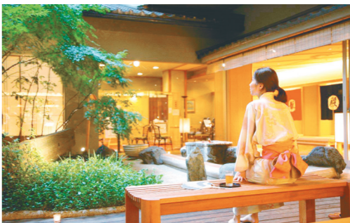
うるわしガーデン

島根県の玉造温泉は、奈良時代に開かれた歴史ある名湯。泉質はナトリウム・カルシウム・硫酸塩・塩化物泉で、美人の湯としても有名。佳苑苑(皆美苑)が、花と緑を眺めながら、湯治みができる。同館では、1階の中庭にある「うるわしガーデン」を中心に、大浴場や露天風呂も併設している。お食事処は、地産地消の会席料理を提供する和食レストラン「華茶屋匠茶屋」、本格フランス料理の「ボンジュール」、中国料理の「來來飯店」が揃う。高山ラーメンが食べられる居酒屋もある。ホテル内には土産物の「ひだ小路」があり、特産のお漬物「赤かぶ」が人気。