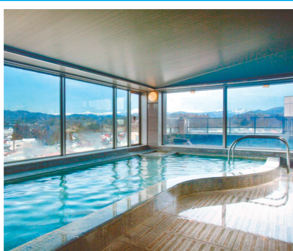
北アルプスを望む「天望の湯」

「浮世風呂」は、東船が08年から湧出したもの。湧出量は毎分406リットル。泉質はナトリウム塩化泉。弱アルカリ性の泉質はお肌にも優しく、肌効果が美人の湯と称される。お食事処は、地産地消の会席料理を提供する和食レストラン「華茶屋匠茶屋」、本格フランス料理の「ボンジュール」、中国料理の「來來飯店」が揃う。高山ラーメンが食べられる居酒屋もある。ホテル内には土産物の「ひだ小路」があり、特産のお漬物「赤かぶ」が人気。