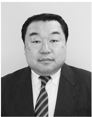
石母田代表取締役