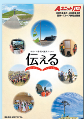
防災・減災プログラム