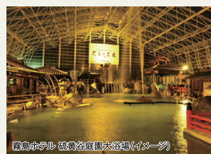
鶴島ホテル 鶴島谷田大浴場(イメージ)