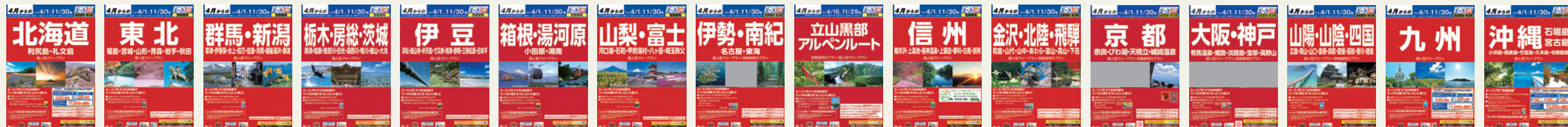
※パンフレットは発地によりデザインと地域分けが異なります。

エースJTBの赤いパンフレットでは品質へのこだわりに加え、お客様に「泊まる」楽しさをお届けするため、それぞれのホテル・旅館の楽しみ方を「エースJTB」のお約束としてご提案しています。