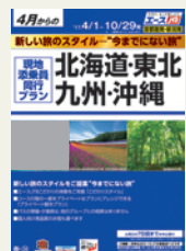
※パンフレットは発地によりデザインと地域分けが異なります。