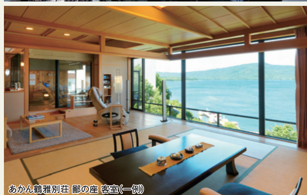
あかん橋別荘 廊下の座 (一例)