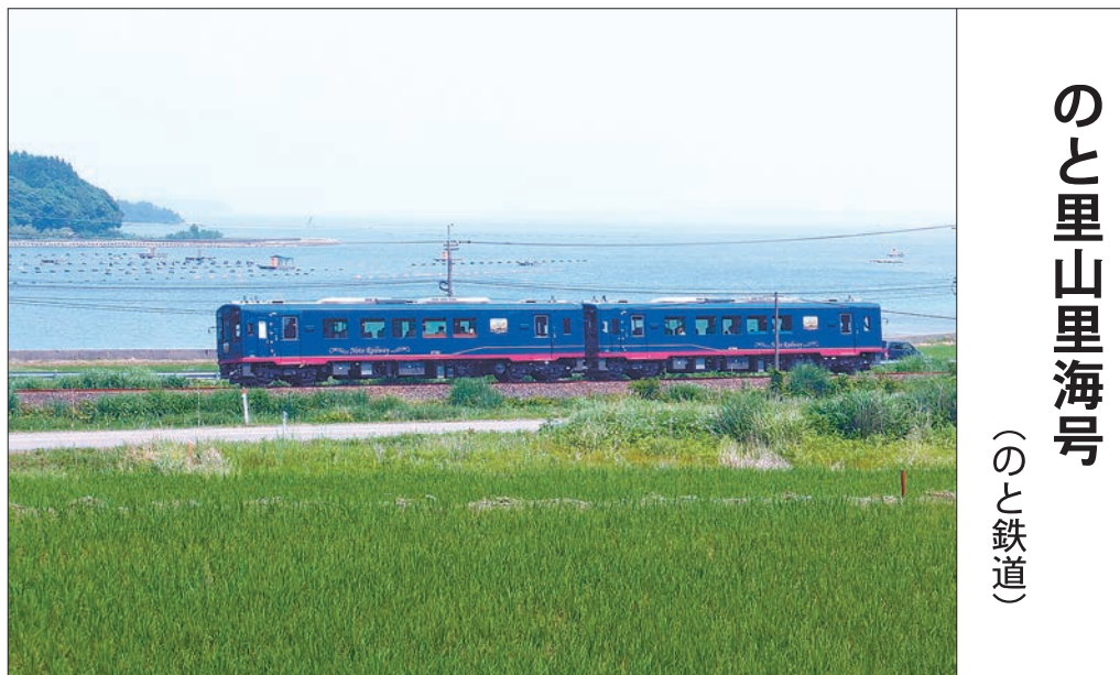
のと里山里海号 (のと鉄道)

2014年5月25日、「丹後あかまつ号」「丹後あおまつ号」に続き、福知山―天橋立(京都府)間などで運行開始。丹後の食材を使ったランチとスイーツ、地酒の各コースを提供。車内は天然木をせいたくに使った落ち着いた空間。