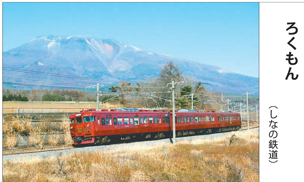
ろくもん (しなの鉄道)

2017年4月1日運行開始。香川県多度津・琴平と徳島県大歩危間を運行。こんびろさん、祖谷地方など、千年を超える歴史的な文化や景観が残る「四国のまんなか」を訪ねる。車両は四季と日本のたたずまいを表現した和の風情。