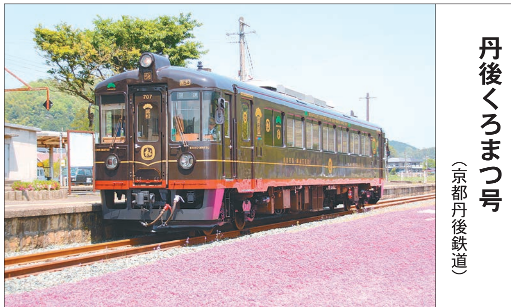
丹後くろまつ号 (京都丹後鉄道)

2016年3月26日、道南いさりび鉄道(北海道)の開業と同時に運行開始。「ながまれ」とは地元の方で「ゆっくりして」「のんびりして」の意味。車内には食事を楽しめるテーブルを設置。道南の名産、道南杉を使用した内装。