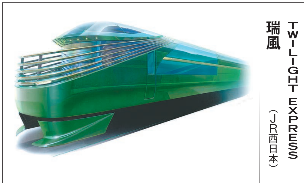
TWILIGHT EXPRESS 瑞風 (JR西日本)

2017年6月17日運行開始。京都、大阪を起点に山陽、山陰を最大2泊3日で巡る。コンセプトは「美しい日本をホテルが走る」。最上級のザ・スイートは1両1室というぜいたくなスペース。本格的なバスタブ付きバスルームを備える。