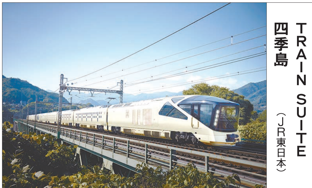
TRAIN SUITE 四季島 (JR東日本)

2017年6月17日運行開始。京都、大阪を起点に山陽、山陰を最大2泊3日で巡る。コンセプトは「美しい日本をホテルが走る」。最上級のザ・スイートは1両1室というぜいたくなスペース。本格的なバスタブ付きバスルームを備える。