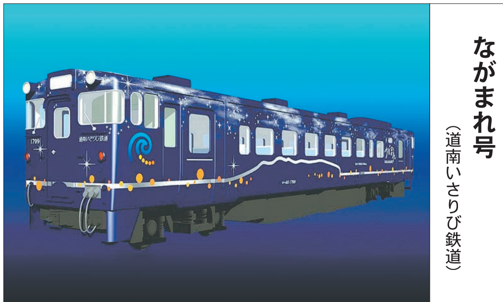
ながまれ号 (道南いさりび鉄道)

2014年7月11日運行開始。軽井沢―長野間を金、土、日、祝日など、年間約180日間運行。長野県産の木材をふんだんに使ったラウンジ風の空間。地元名店のシェフによる、地元の旬の食材を使った洋食コースと和食懐石料理を提供。