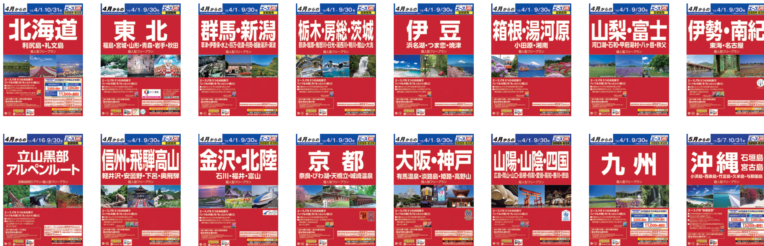
※2015年度上期首都圏発パンフレット ※出発地により、パンフレット毎の方面名が異なります。