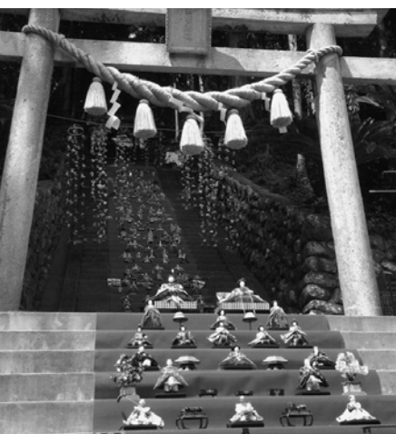
素盞鳴神社の雛段飾り

つるし飾りは、メイン会場の文化公園雛の館に約1万1千個、雛の館「むいかい庵」に約7000個を展示するほか、旅館、一般住宅などにも飾られる。町内各地ではつるし飾りの製作体験もできる。