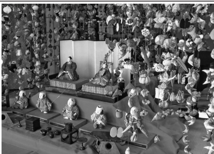
稲取温泉に受け継がれている雛のつるし飾り

静岡県伊豆町の稲取温泉で「雛のつるし飾りまつり」が1月20日に開幕する。主催は稲取温泉旅館協同組合。地域の伝統的な風習を今に伝えるイベントで18回目を迎える。「文化公園雛の館」などにつるし飾りを展示するほか、神社の階段を使った雛段飾り、イルミネーションイベント、スタンパラリーなどを行う。期間は3月31日まで。