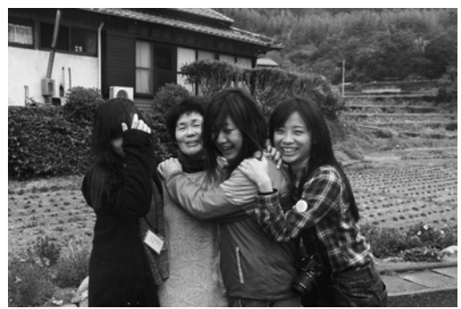
心の豊かさを育む田舎体験 (長崎県五島市)

心の豊かさを育む田舎体験 (長崎県五島市)。体験型観光の現場風景。心の豊かさを育む田舎体験 (長崎県五島市)。体験型観光の現場風景。心の豊かさを育む田舎体験 (長崎県五島市)。