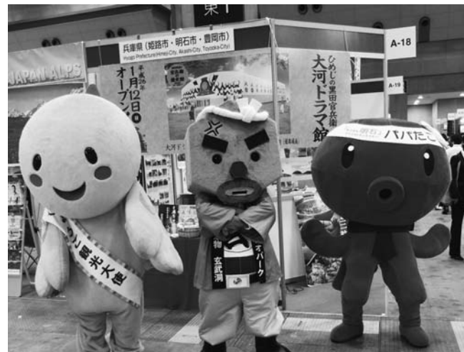
昨年9月に行われた「JATA旅博」も、ご当地キャラクターの出演や海外の伝統音楽の披露などで盛り上がった