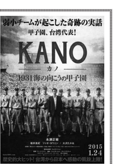
台湾映画「KANO」の日本公開1月から