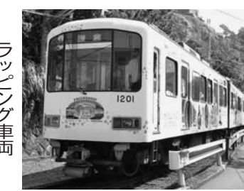
江ノ電にラッピング車両