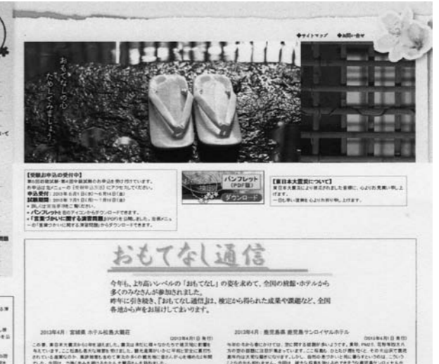
受験情報や合格者の声を伝える公式ホームページ(部分)

「おもてなし検定」は、旅館の公式ホームページ(部分)に載せられている。旅館の公式ホームページには、経営のひらき、収益向上と顧客満足度の追求を目指す。第1回は10月17日に伊豆箱根温泉、銀水荘で、第2回は来年2月3日、4日におもてなし温泉、湯元館で開催予定。2日コース受講料は2万5千円。 おもとなし検定 「おもてなし検定」は、旅館の公式ホームページ(部分)に載せられている。旅館の公式ホームページには、経営のひらき、収益向上と顧客満足度の追求を目指す。第1回は10月17日に伊豆箱根温泉、銀水荘で、第2回は来年2月3日、4日におもてなし温泉、湯元館で開催予定。2日コース受講料は2万5千円。 おもとなし検定 「おもてなし検定」は、旅館の公式ホームページ(部分)に載せられている。旅館の公式ホームページには、経営のひらき、収益向上と顧客満足度の追求を目指す。第1回は10月17日に伊豆箱根温泉、銀水荘で、第2回は来年2月3日、4日におもてなし温泉、湯元館で開催予定。2日コース受講料は2万5千円。