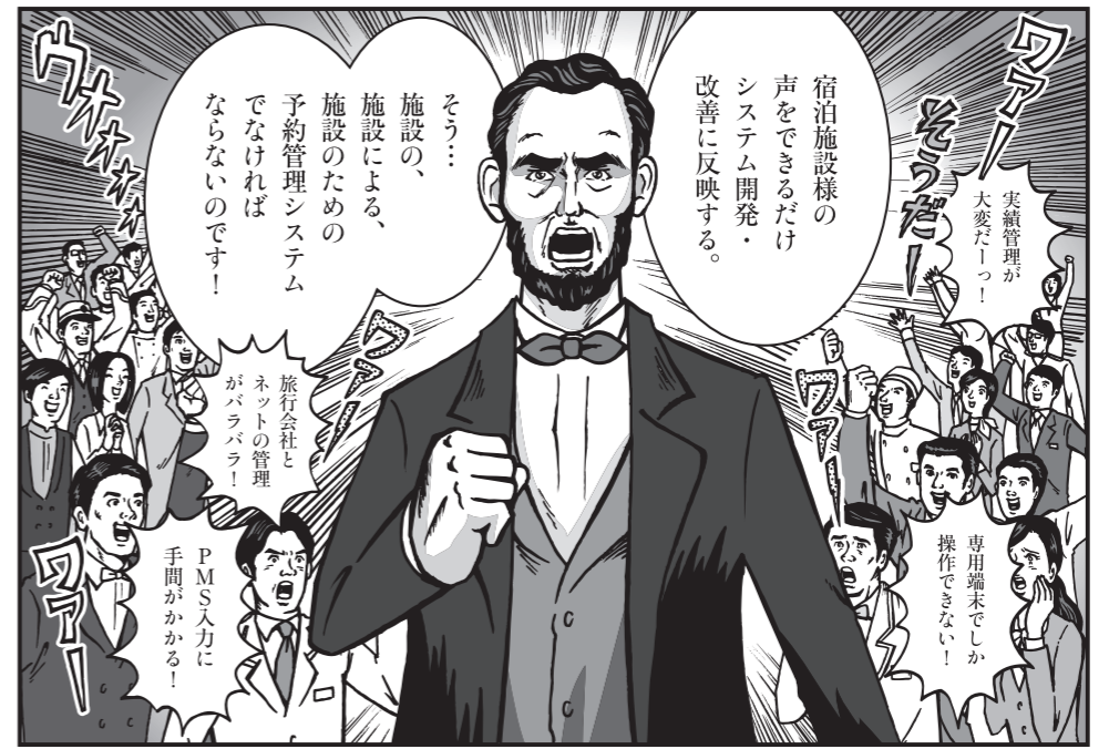
TL-Lincoln導入後のお客様の「声」を大切にします。ここ1年間の実績は、お客様の「声」をもとに300件以上のシステム改善を実施。次期システムの開発もお客様の「声」をもとに行なっています。