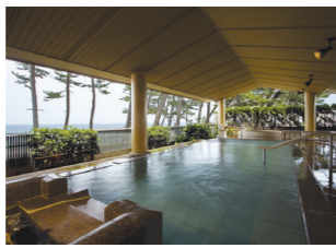
露天風呂「大山の湯屋」

鳥取県米子市皆生温泉4-19-10 TEL.0859-33-0001 http://www.kaike-grandhotel.co.jp