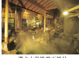
讃大浴場露天風呂

香川県仲多度郡琴平町85-11 TEL.0877-75-1000 http://www.kotosankaku.jp