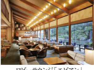
ロビーラウンジ「エビアン」

岐阜県下呂市幸田1268 TEL.0576-25-2800 http://www.suimeikan.co.jp