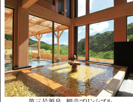
第三号源泉 観音プリンシプル

石川 輪島・ねぶた温泉 全館畳敷、広大な日本海を望む2軒の温泉宿 輪島市郊外の自然豊かな海岸線高台に建つ2軒の温泉宿。pH10のアルカリ温泉はつるつるの肌になります。お食事は能登の味覚を地元輪島産の器とともにお楽しみいただけます。