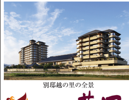
別邸越の里の全景

新潟 月岡温泉 「館内は、和洋を融合させたくろぎ空間」 美人になれる温泉として名高い白玉の湯を庭園大浴場「月鏡」に存分に「巨岩」を配した日本庭園。自然を感じさせる露天風呂。お食事会場「料亭旬景」も好評を頂いております。