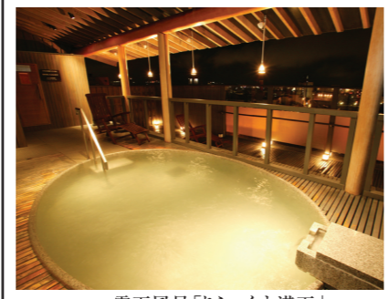
露天風呂「りらくす満天」

香川 こんぴら温泉郷 こんぴらさんのふもとにある温泉旅館 ふるから、こんぴらさんの門前で築きあげた心あたたまる町。人と歴史が織り上げてきたすばらしきこんぴら情緒。風雅な寛きこころを、古き良き日本心をゆつたりと堪能下さいませ。