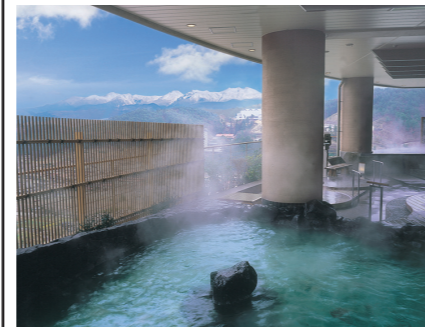
7Fの岩風呂から北アルプス一望

岐阜 飛騨高山温泉 ゆつくり寛げるお部屋食の宿 白い土蔵の中がお風呂になっている「りらくす満天」は大人の女性専用ラウンジスペース。男性は展望露天風呂「りらくす満天」で風を感じながら温泉満喫。赤い中橋のたもと、古い町並み徒歩1分。気おけない仲間や家族で気兼ねなく飛騨高山を心行くまで楽しんで。