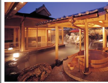
庭園露天風呂外湯

岐阜 下呂温泉 癒しの空間 心洗われて 飛騨川沿いに建つ老舗旅館「水明館」。趣き異なる3ヶ所の大浴場があり、滑らかな下呂の湯が堪能いただけます。また、温泉プールやエステの他、日本文化を感じる能舞台や茶室などもあり、様々な滞在をお楽しみいただけます。