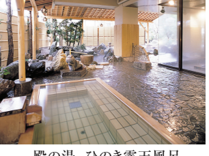
殿の湯 ひのき露天風呂

新潟県新発田市月岡温泉278-2 TEL.0254-32-2000 http://www.seifuen.com