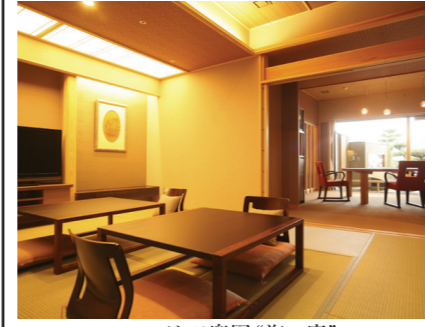
ヴィラ楽園「海の庭」