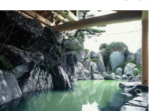
巨岩をグイグイに配した露天風呂「月鏡」

新潟県新発田市月岡温泉453番地 TEL.0254-32-1111 http://www.senkei.com