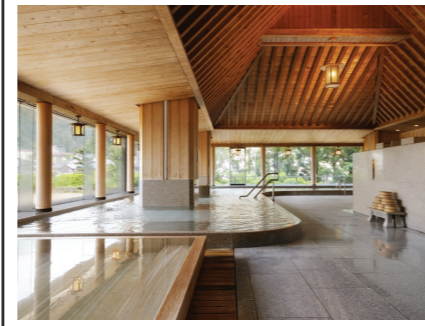
檜の香る臨川閣「下留の湯」

岐阜 飛騨高山温泉 天然温泉と極上の癒し 標高640m、高山の丘に建つホテルアソシア高山リゾート。すべての部屋、温泉棟スパウィング「天望」の露天風呂が望める。雄大な北アルプスが望める。自然の幸をとり入れたメニューが、和洋折衷の素材を扱った料理を用意しています。