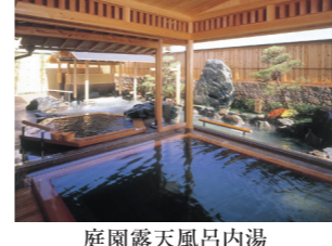
庭園露天風呂内湯

三重県志摩市磯部町渡野517 TEL.0599-57-2910 http://www.fukujuso.co.jp