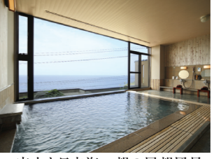
広大な日本海一望の展望風呂

石川県輪島市大野町ねぶた温泉 TEL.0768-22-0213 http://www.notonosho.co.jp