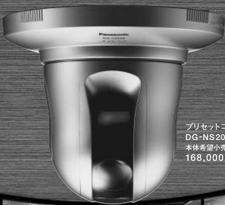
プリセットコンビネーション ネットワークカメラ DG-NS202A 本体希望小売価格 168,000円(税抜160,000円)