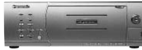
IPネットワークディスクレコーダー DG-ND200 本体希望小売価格365,400円(税抜348,000円) 前面取り出し構造の耐衝撃リムーバブルHDD(別売)採用で、場所を取らない省スペース設計。最大16台のネットワークカメラを接続可能。