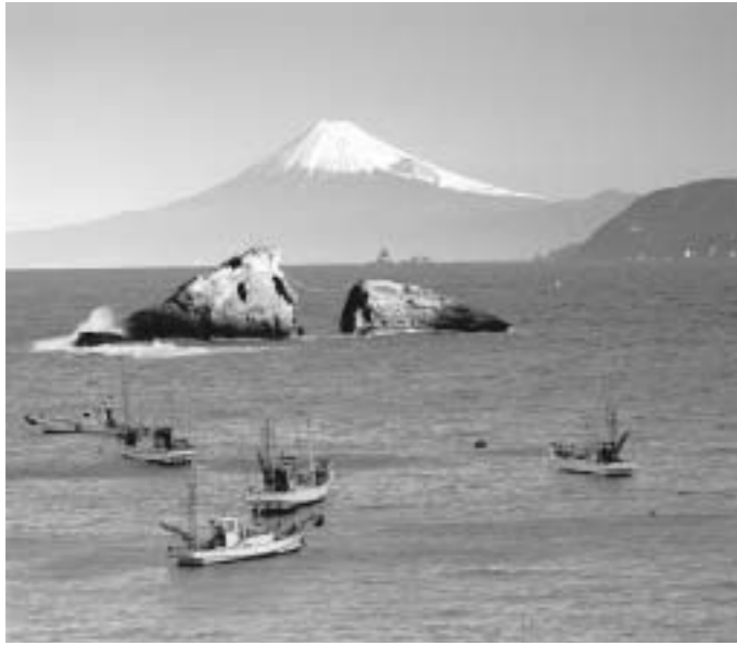
雲見海岸からの富士山