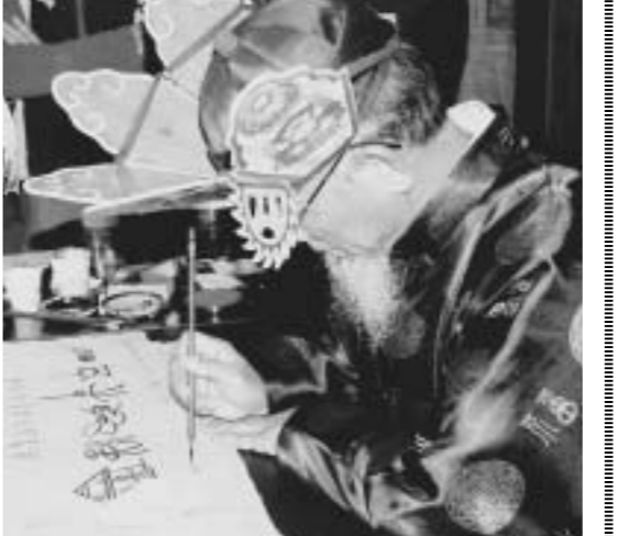
トンパ文字を書くトンパ先生

トンパ文字は1500年ほど前にトンパ族が2千年前に作り出した。現在、トンパ族が10人程度しか残っていない。文化遺産には1997年に登録された。この文字はナシ族が太陽、月などの自然物を崇拜する「トンパ教」の経典を記述するために用いたところからトンパ文字と呼ばれるようになった。