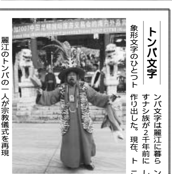
麗江のトンパの一人が宗教儀式を再現

石林風景名勝区は今年世界自然遺産に登録された。総面積は1,000平方キロメートル。高さ200mから300mの石灰岩の石柱が林立する。世界遺産に13年前に一度申請をした。トンパ教は冠婚葬祭や、病気の時、邪氣払いの時は、宗教儀式を司る祭司「トンパ」を呼んで儀式を行ってもらう。トンパ文化研究所は麗江古城エリアの北にある緑と水に囲まれた公園「黒龍潭」に位置する。トンパ文字教室が開校されており、本物のナシ族がトンパ文字を教える。