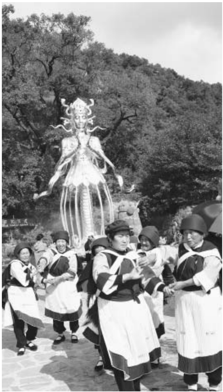
ナシ族の民族舞踊を披露