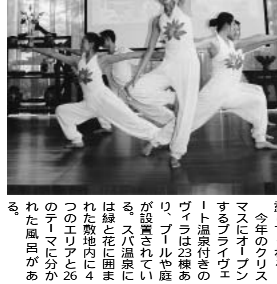
昆明市内の喧騒を離れたブリアント・リゾートの麗江湖畔に位置する、スバは、南国リゾート茶道パフォーマンスやヨガパフォーマンス、スリ・写真などを披露している。今年のクリスマスにオープンするアライヴエリート温泉付きのグレイズは23棟あり、プールや庭が設置されている。スバ温泉には緑と花に囲まれた敷地内に4つのエリアと26のテーマに分かれた風呂がある。

麗江は野生動物植物の宝庫で、これら眺めながら湿地帯に続く遊歩道は散歩コースとして勧めたい。湖のほとりの緑に野生のリスが生息しており、間近で見られた。