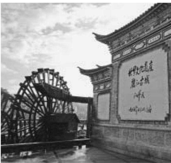
古城水車が回る入り口

麗江には世界遺産が2カ所登録されており、文がある。古い町並み麗江古城、化遺産の「麗江古城」、古い町並み麗江古城