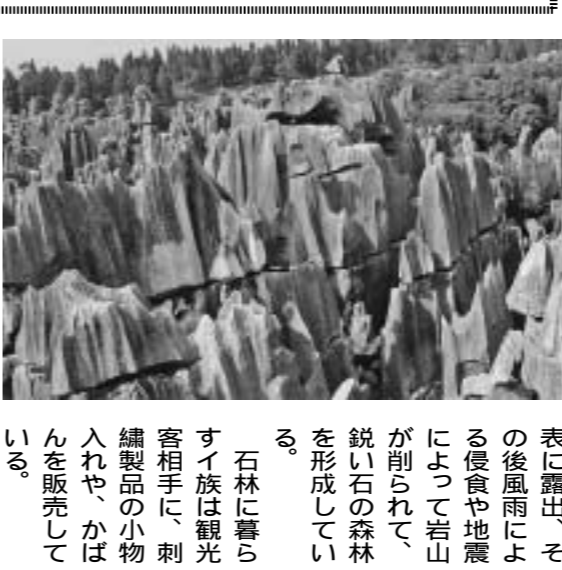
険しい石柱が連なる