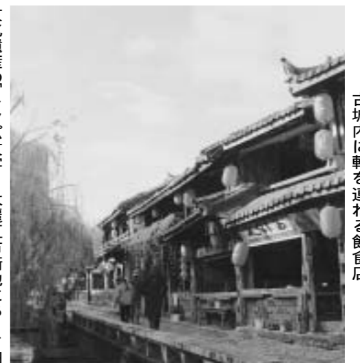
古城内に軒を連ねる飲食店

麗江には世界遺産が2カ所登録されており、文がある。古い町並み麗江古城、化遺産の「麗江古城」、古い町並み麗江古城