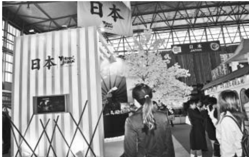
日本ブースには桜の木が飾られた