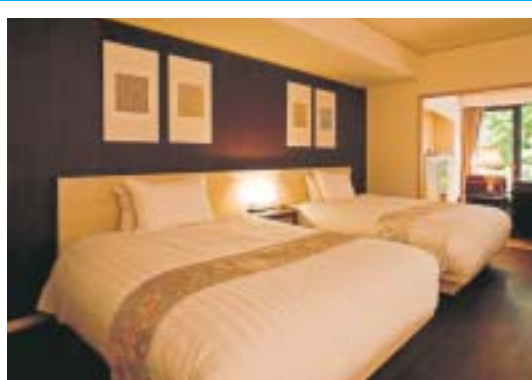
洋室にはシーリーベント

洋室にはシーリーベント。源泉かけ流し。源泉の温度は53度。毎分427リットル、1日約61万リットル湧き出る。露天風呂は、源泉かけ流し。