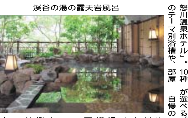
渓谷の湯の露天岩風呂

鬼怒川温泉ホテル。10種類の温泉スタイル。大浴場に「エッセンス」のテーマ別浴槽や、部屋、自慢のスパゾーン「湯」が備わっている。