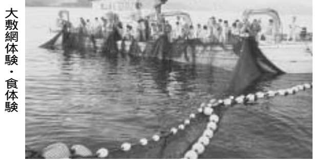
大敷網体験・食体験