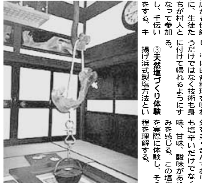
いろいろ(春蘭の宿)