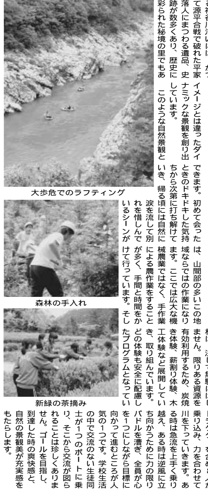
大歩危でのラフティング