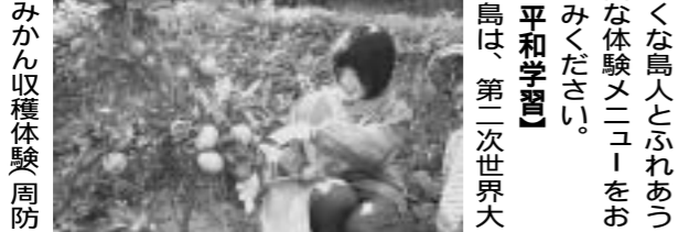
広島湾の自然を体験する