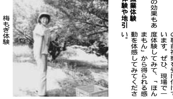
和歌山の自然を体験する

和歌山県では、平成14年4月で作成された「和歌山県観光振興計画」に基づき、観光振興に取り組んでいます。 和歌山県では、平成14年4月で作成された「和歌山県観光振興計画」に基づき、観光振興に取り組んでいます。