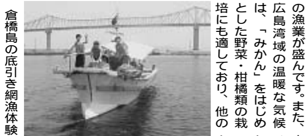
広島湾の美しい景色