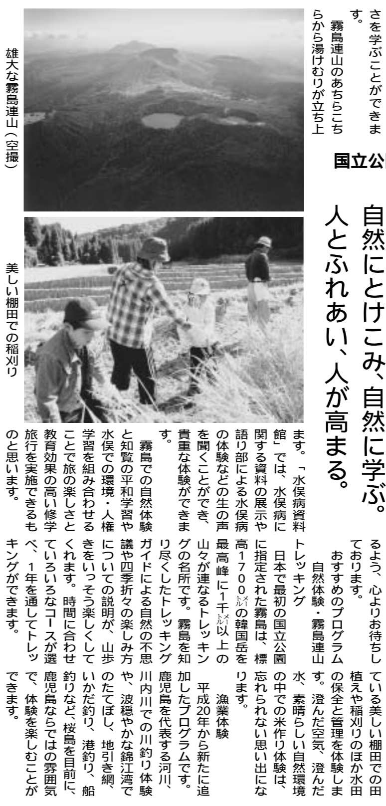
雄大な霧島連山(空撮)