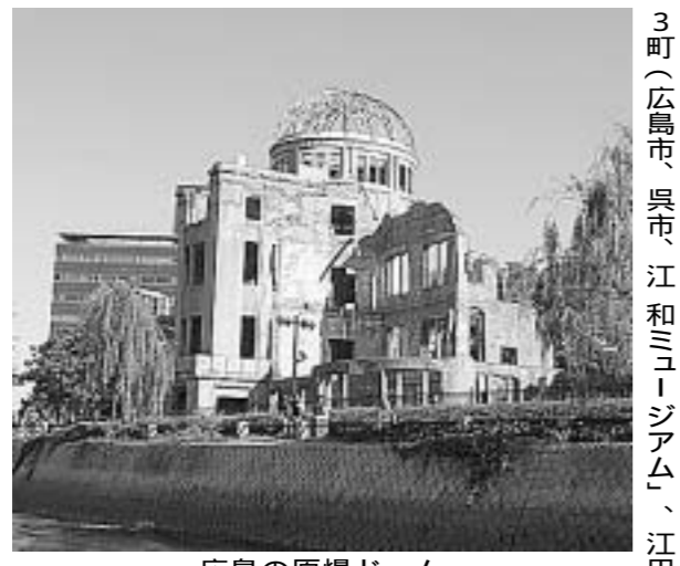
広島湾の原爆ドーム