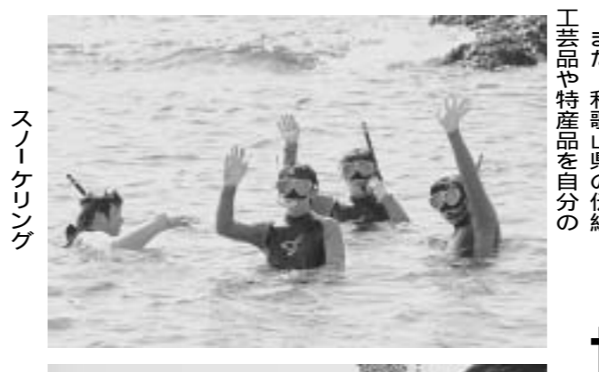
和歌山の自然を体験する