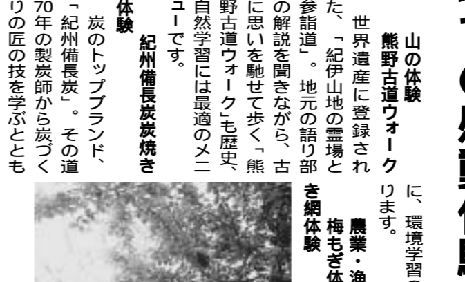
和歌山の自然を体験する