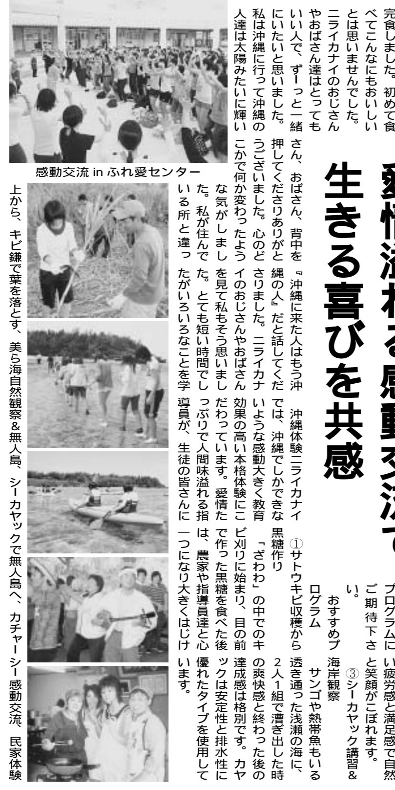
感動交流 in ふれ愛センター