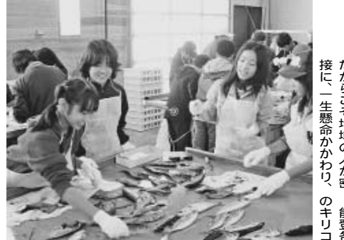
海の恵みを体感する