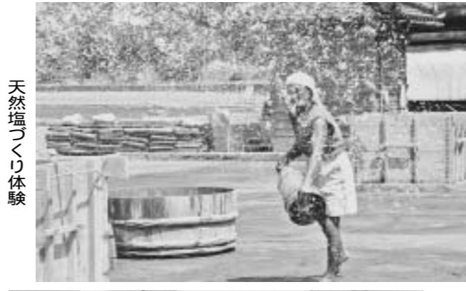
自然塩づくり体験