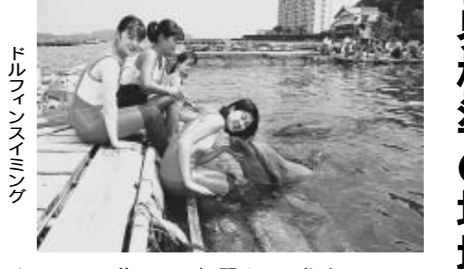
和歌山の自然を体験する