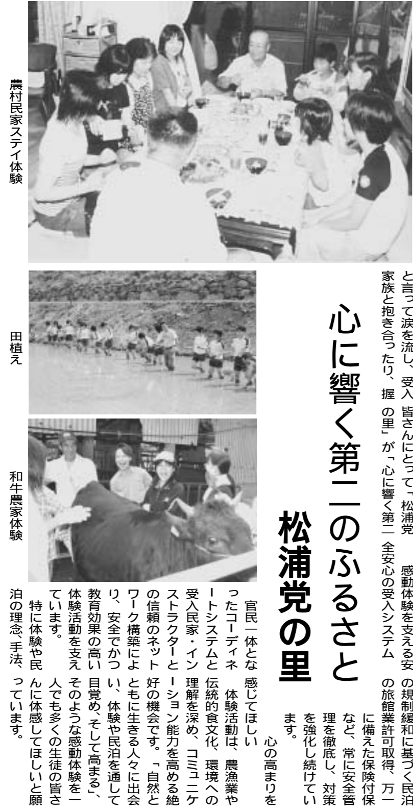
農村民家ステイ体験