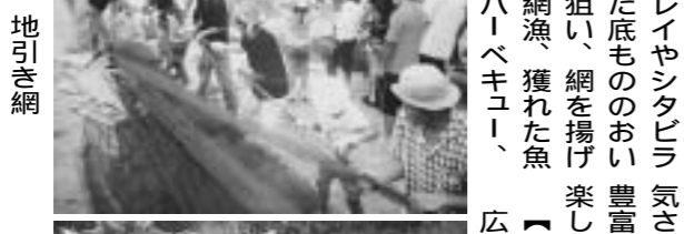
広島湾の自然を体験する