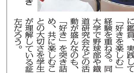
就職EXPOで真剣に聴き入る学生たち

文教大学国際学部は、「国際理解学科」と「国際観光学」の2学科で構成されている。世界を学ぶ力を育む。国際情勢の変化や価値観の多様化により、さまざまな場面で国際性の再構築が求められる。2021年4月に誕生した新しいキャンパスで、東武スカイツリーライン谷塚駅から徒歩、つくばエクスプレス六町駅からバスなどアクセス便利な立地にある。 国際学部の特徴は、教室での学びと体験知を結びつける「体験型学習」にあり、海外研修、発展途上国支援プロジェクト、観光ビジネスサートの探究、まちづくり参加などを通じて学生は大きく成長する。一方、きめ細やかな語学教育では学生を徹底的に鍛える。 国際学部での学びのキーワードは「体験知」。グローバルを味わう世界レベルの語学を習得。英語教育も「二」から「三」へ、「国際理解学科」では、