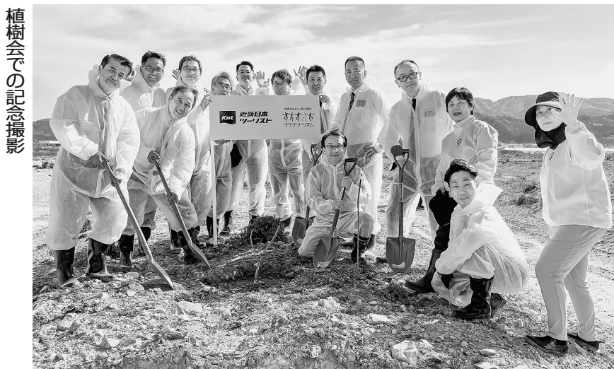
植樹会での記念撮影

KNT-CTグループでは東日本大震災の被災地への応援ツアー実施などを通じた復興支援に取り組んでいる。グループ傘下の近畿日本ツーリスト商事も、これまでピーカンツッチョコレートシリーズなどを提供するサロンドロロイアル(大阪府)・岩手県陸前高田市(東京)大学の3者が共同で農業創生などに取り組む「ピーカンツッチョプロジェクト」を支援してきた。今年3月、東日本大震災の発生から15年を迎えたことから3者