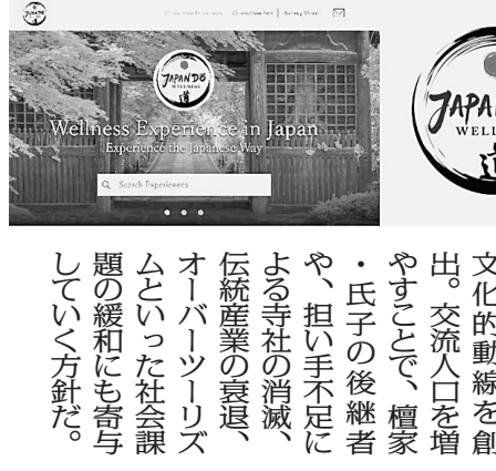
植樹会での記念撮影

KNT-CTホールディングス(HD)は自治体との包括連携協定の締結を推進している。昨年10月10日には、岐阜県高山市と観光振興や地域活性化に関する包括連携協定を締結した。今年3月11日には、島根県と、地域活性化と県民サービスの向上を図る目的で包括連携協定を締結した。KNT-CTグループの各社から社員が地域に入り、自治体と抱える課題の解決を目指してさまざまな取り組みを行っている。