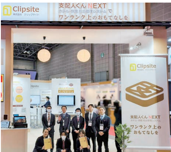
昨年の「国際ホテル・レストラン・ショー」