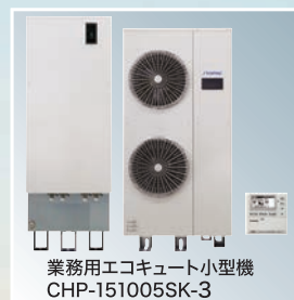
業務用エコキュート小型機 CHP-151005SK-3

“業務用電気給湯システムの専門メーカー”日本イトミックは、あらゆるシーンに最適な給湯システムをお届けします。