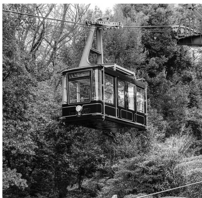
■松山城ロープウェイ・リフト/松山市 松山城の山麓駅「東雲口」から8合目付近の山頂駅「長者ヶ平」を結ぶ。2月にロープウェイのゴンドラがリニューアルし、青色のロイヤルブルーを基調としたデザインに。城山上で発生した土石流により営業休止していたが、7月31日に危険箇所を除き全面営業再開した。

※①「大観覧車くるりん」のピーク時入り込み客数は、人数を把握できている2015年度以降のピーク値。(実際のピーク時の数値とは異なる) ※②「しまなみ海道レンタサイクル」は、2022年4月から4CS(サイクルステーション)が2CSに減少した。2019年度まで通って2CSのデータに修正を行った。 ※③2020年4月1日から現在の館名に変更。(旧: 村上水軍博物館) ※④「マイントピア別子」は2021年度から集計方法を変更。