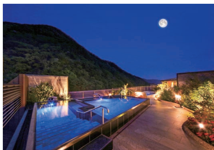
空中庭園露天風呂