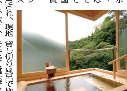
観音温泉 本館 満天檜風呂