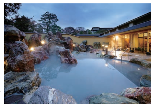
「カルナ」の庭園露天風呂