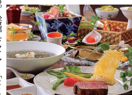
個室料亭での会席料理