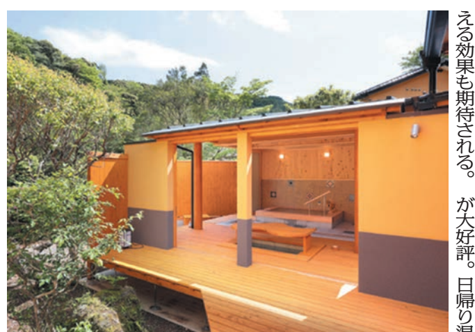
四つのコネクティングルームが誕生した産土亭