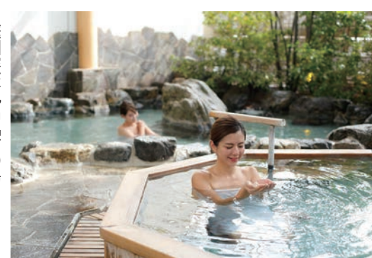
庭園露天風呂「右の湯」