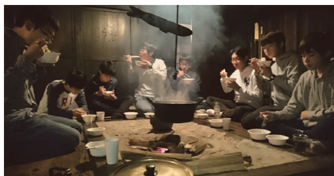
いろいろの里大平宿 200名

農作放棄地や後継者が確保できない農地を引き受けて、果樹、野菜、穀物の生産、食品加工、古民家の再生など農村の暮らしにまで迫る農業生産法人。日本の農業が抱える多くの課題を共有し、食生産現場の未来と食料自給と地域振興を考える。