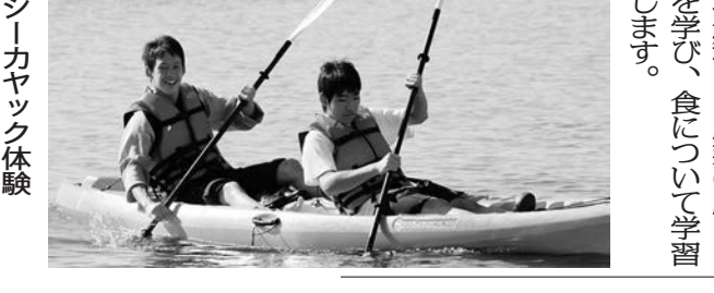
シーカヤック体験