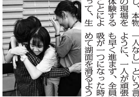
漁村文化を肌で体験