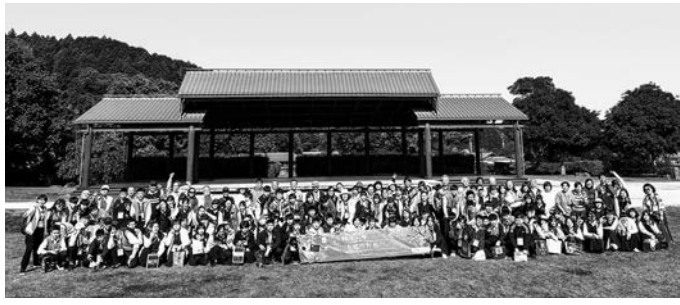
台湾からの受け入れを再開(5月)