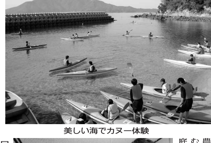
美しい海でカヌー体験