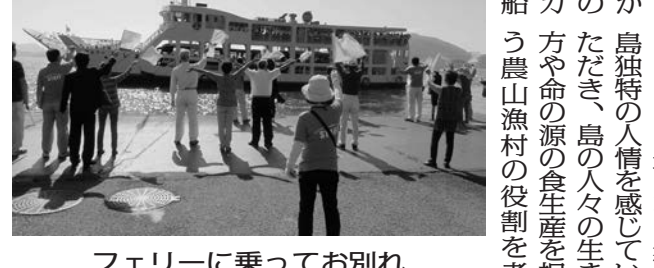
フェリーに乗ってお別れ