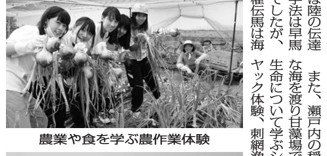
農業や食を学ぶ農作業体験