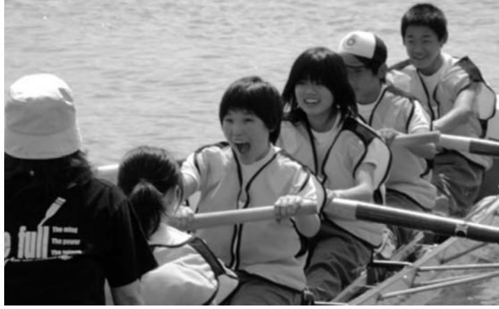
チームワークを育むボート体験