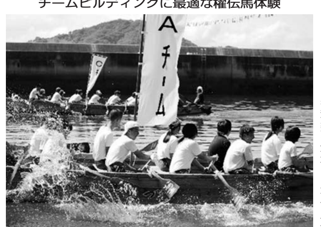
チームビルディングに最適な権伝馬体験