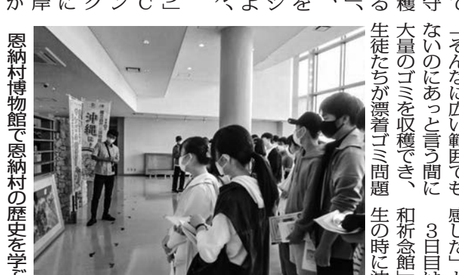
民泊の歴史を学ぶ

講演会や、国際連帯の... 人とつながり」を体験... 持続可能な社会」も学習...」