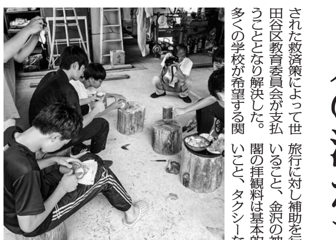
竹製マグカップ作り体験