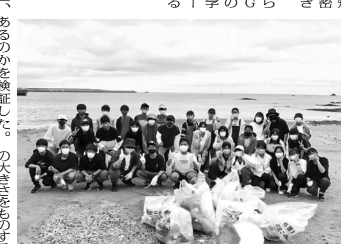
海岸で大量の漂着ゴミを回収

講演会や、国際連帯の... 人とつながり」を体験... 持続可能な社会」も学習...」