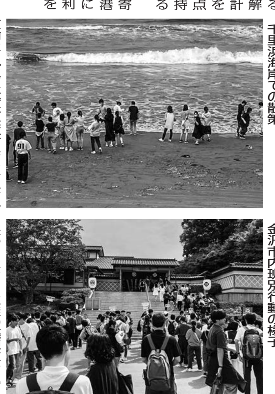
千里浜海岸での散策

飛行機利用によって世田谷区教育委員会が... 人の温かさに触れる民泊... 移動時間が短縮され、活動時間が広がった。学校では生徒が...」