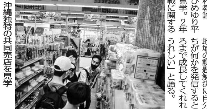
沖縄独自の共同食を学ぶ