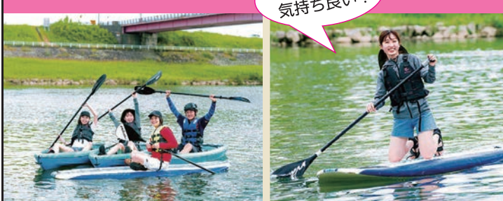
筑後川 ウォーターアクティビティ