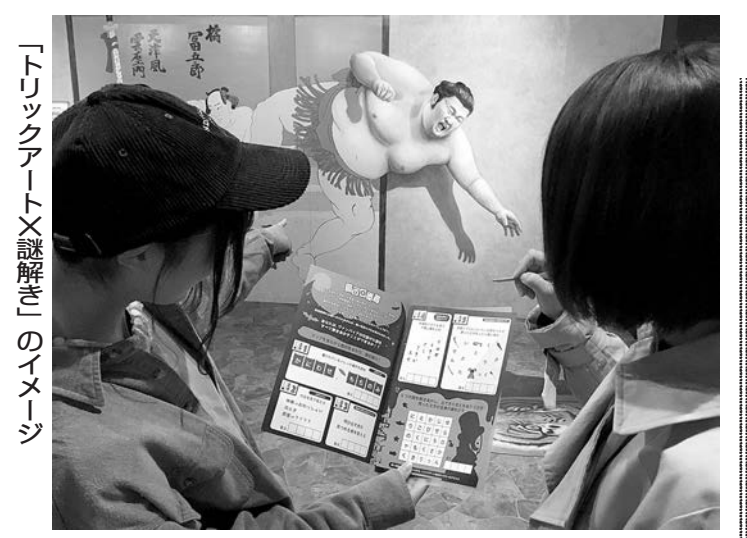
海のエリア「ランタンファンタジー」

日本発祥の参加型体験型アート「トリックアート」の平面の絵が飛び出したり、角度により違う雰囲気に見えるたりする不思議なアートだ。栃木・那須高原と東京・お台場にあるトリックアートの常設館は、これらの作品を見るだけでなく、写真に撮ったり、錯覚を感じたりとさまざまな体験ができる。思い出し「おもてなし」芸術性を学び、発想力を養える体験。見学地、中学や高校の修学旅行で人気を集めている。