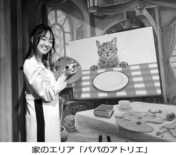
家のエリア「パパのアトリエ」

「東京トリックアート迷宮館」は、江戸をテーマにした和風のトリックアート。謎解きや写真撮影など、さまざまな体験ができる。館内には、江戸の風景を再現した。謎解きや写真撮影など、さまざまな体験ができる。