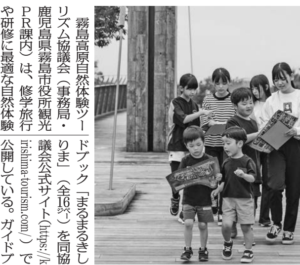
霧島高原自然体験ツーリズム協議会

霧島高原自然体験ツーリズム協議会が、自然体験ガイドブックを公開した。このガイドブックは、霧島高原の自然体験コースを紹介し、観光客の利便を図る。また、SDGsの目標「持続可能な観光」を推進する。ガイドブックは、観光客の利便を図る。また、SDGsの目標「持続可能な観光」を推進する。