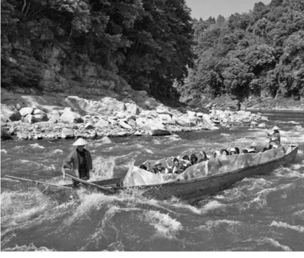
天竜川でのラフティング

南信州 天竜舟下りやラフティング 和船で天竜川を下る歴史がある。飯田市内野島飯田市の「天竜舟下り」が連年再開される。SDGs(持続可能な開発目標)の目標「学習や環境学習」を推進する。SDGs(持続可能な開発目標)の目標「学習や環境学習」を推進する。SDGs(持続可能な開発目標)の目標「学習や環境学習」を推進する。