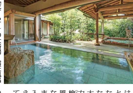
香川県・こんぴら温泉郷 「花の湯」の大浴場・露天風呂

湯元こんぴら温泉は、15種類の湯を巡ることができる。湯元こんぴら温泉は、15種類の湯を巡ることができる。湯元こんぴら温泉は、15種類の湯を巡ることができる。