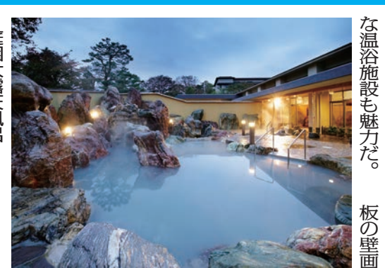
富山県・金太郎温泉 庭園露天風呂

金太郎温泉(大井)は、共用部を改装し、魅力向上を図っている。金太郎温泉(大井)は、共用部を改装し、魅力向上を図っている。金太郎温泉(大井)は、共用部を改装し、魅力向上を図っている。