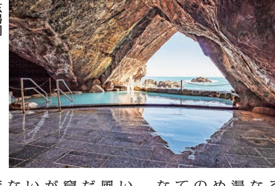
和歌山県・南紀勝浦温泉 忘備洞

三方が海に面した岬に、本館、山上、山麓の3つの温泉地を擁する。三方が海に面した岬に、本館、山上、山麓の3つの温泉地を擁する。三方が海に面した岬に、本館、山上、山麓の3つの温泉地を擁する。