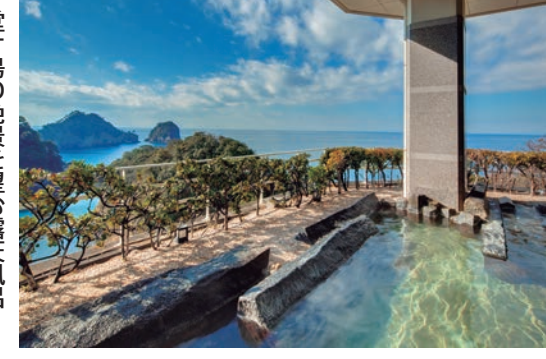
静岡県・堂ヶ島温泉 堂ヶ島の絶景を望む露天風呂

海抜500mの高台から青いフロントの堂ヶ島ニュー銀水は、絶景が広がる。海抜500mの高台から青いフロントの堂ヶ島ニュー銀水は、絶景が広がる。海抜500mの高台から青いフロントの堂ヶ島ニュー銀水は、絶景が広がる。