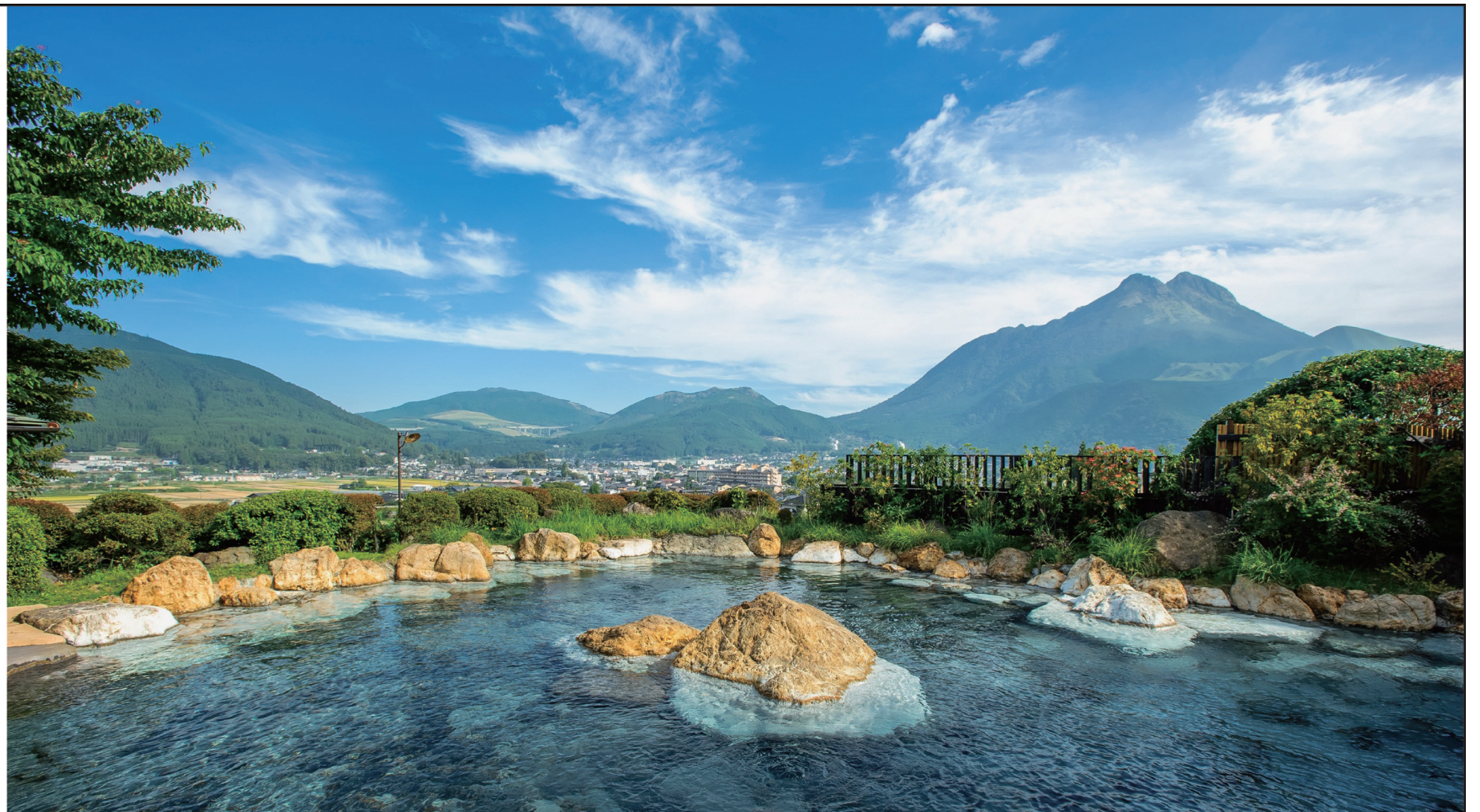
由布岳の見えるまち 大分県由布市

由布院、湯平、塚原と点在する旅館に滞在しながら、名水や峡谷を巡り、土地の実りを味わい、温泉でのんびり保養してってください。