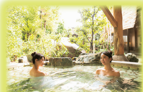
湯元こんぴら温泉華の湯 紅梅亭の温泉

そして気持ちを新たに、眺望に心奪われながらも足元に気を付けながら長い石段を下っていくと、そこにはこんぴら温泉郷が広がる。「肌に優しい」と誉れ高い同温泉郷の温泉にゆったりとつかかり、石段下りの程よい疲れを心穏やかに癒やす…こんぴら温泉郷来訪者だけが味わえる醍醐味だ。