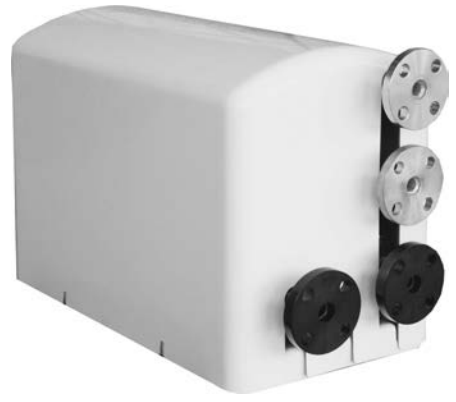
小型浴槽用温ニット子熱

新田 一例として、安全管理を行う専任の技術者が減少している中、湯守の監視センサーを提供し、お手伝い状態、水質維持、警報など、どの管理や故障把握であ