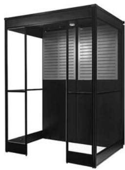
スモーククリア4人用

エルゴジャパン(東京)を活用して都品川区)が開発した高もろいた性能喫煙ブース「SMOKE CLEAR」(「SMOKE」は「煙」の意、「CLEAR」は「クリア」)は、飲食二店を中心に支持を集め、業界最多クラスの3千台以上の導入実績を誇る。 2020年4月に施行された改正健康増進法により、店内での喫煙が原則認められなくなり、旅業・ホテルを含む施設は分煙エリアを新設するなどの対策に苦慮する。「飲食の場で喫煙を希望する人は多くいるため、はじめてとする多層フィルタ構造を採用したことが快過に過せる喫煙環境「クリア分煙」を実現するSMOKE CLEAR 厚生労働省が定める技術基準を全てクリアし、かつ、最高性能でありながら、ローコスト。コロナ禍により、旅館・ホテルは、厳しい状況が続いているが、クリア