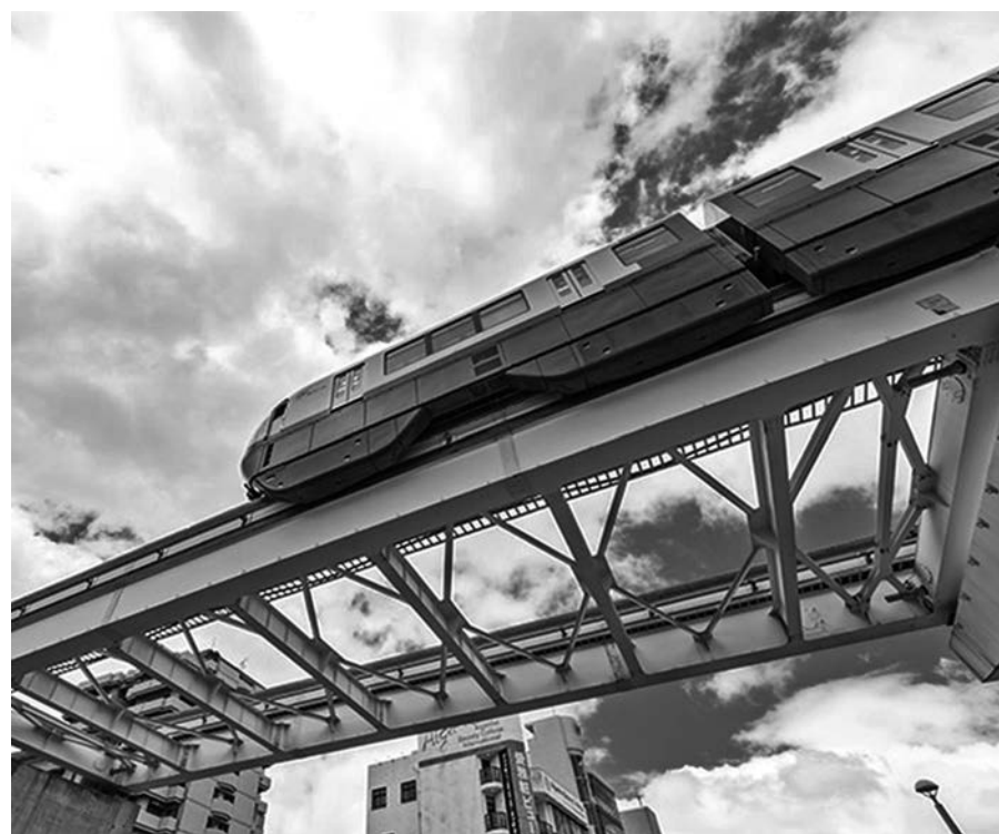
ゆいレール(沖縄都市モノレール)